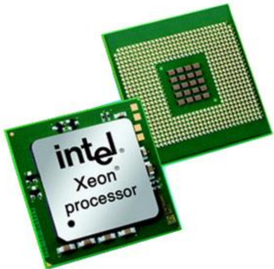
Рис.3 Intel Original LGA1366 Xeon E5502 (1.86 / 4.8GT / sec / 4M)