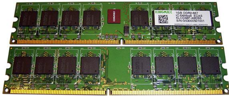
Модуль памяти Kingmax DDR2-667

Для того чтобы этого не происходило, рекомендуется произвести дефрагментацию диска и установить для файла подкачки постоянный размер .