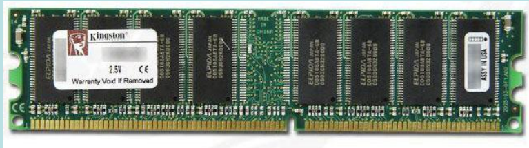
Модуль памяти Kingston DDR PC3200