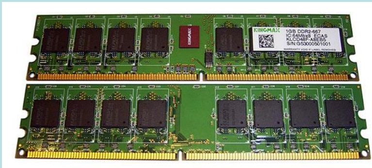
Модуль памяти Kingmax DDR2-667

Важнейшей характеристикой модулей оперативной памяти является пропускная способность .