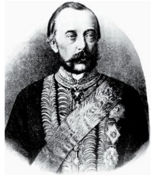
Толстой Дмитрий Андреевич, Министр внутренних дел и шеф жандармов

Внутриполитический курс Александра III выразился в проведении мер, направленных на ограничение реформ 60-70-х гг. и поэтому получивших название "контрреформы" .