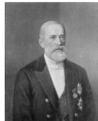
Бунге Н.Х. министр финансов