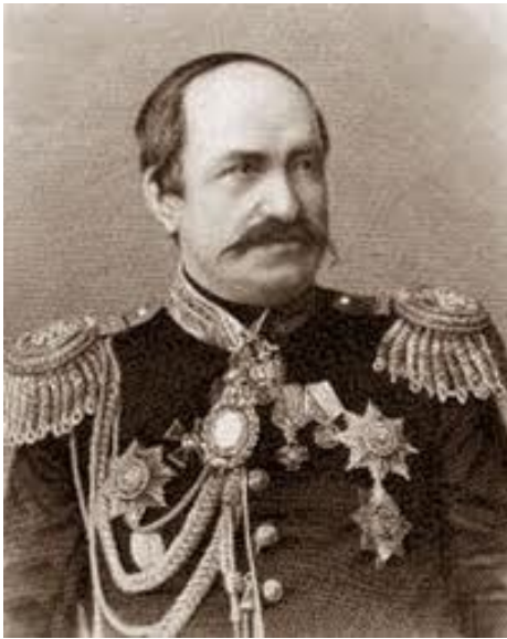
Игнатъев Николай Павлович, министр внутренних дел