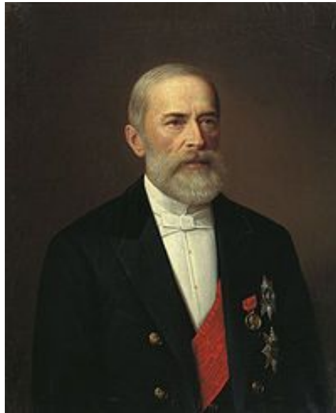
Бунге Николай Христофорович, министр финансов