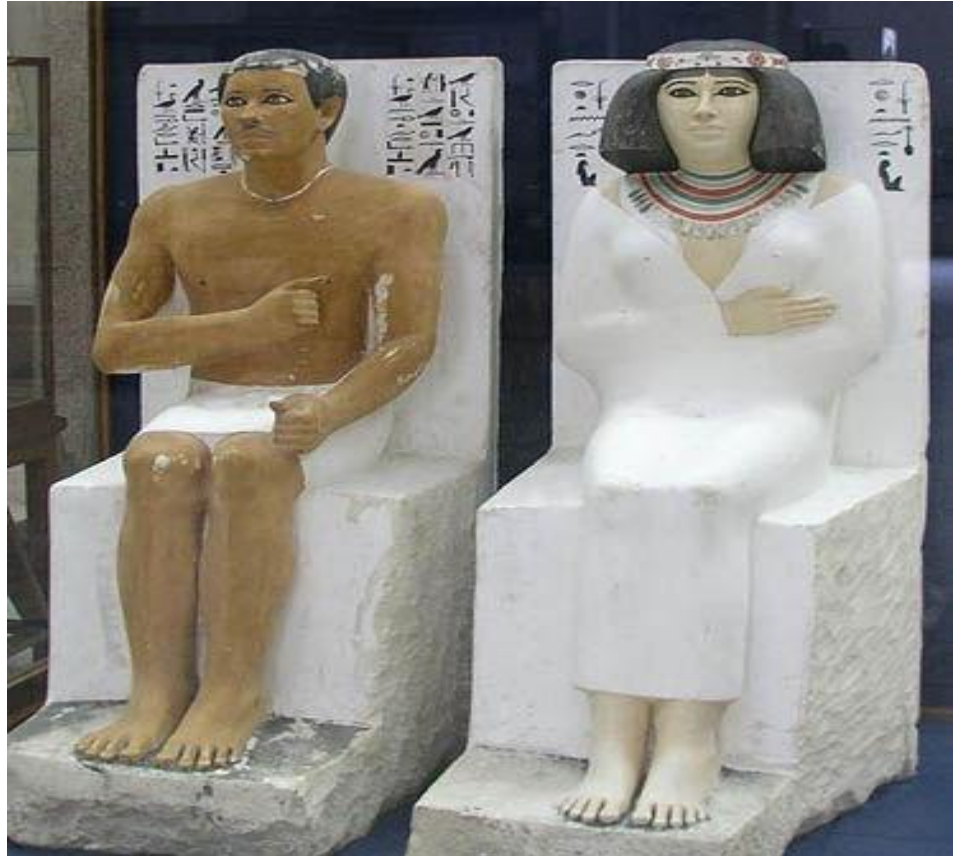
Вельможа Рахотеп и его жена Неферт

В гробницах ставили каменную или деревянную статую умершего, в точности воспроизводящую его облик.