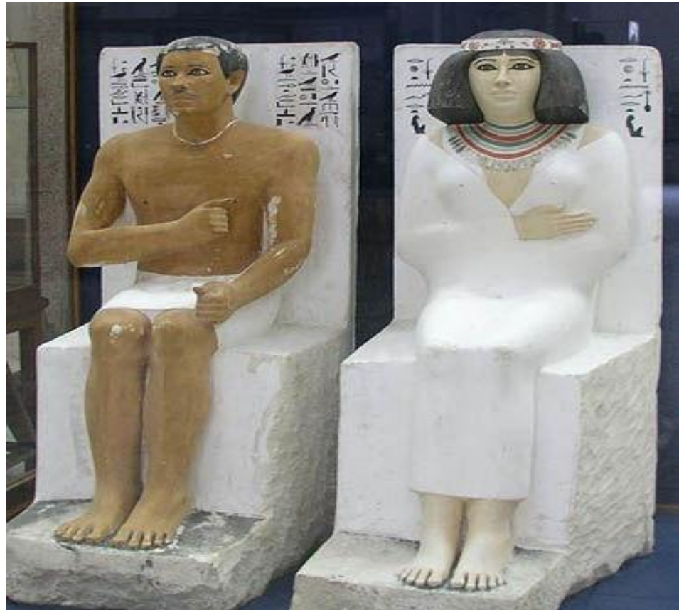
Вельможа Рахотеп и его жена Неферт

В гробницах ставили каменную или деревянную статую умершего, в точности воспроизводящую его облик.