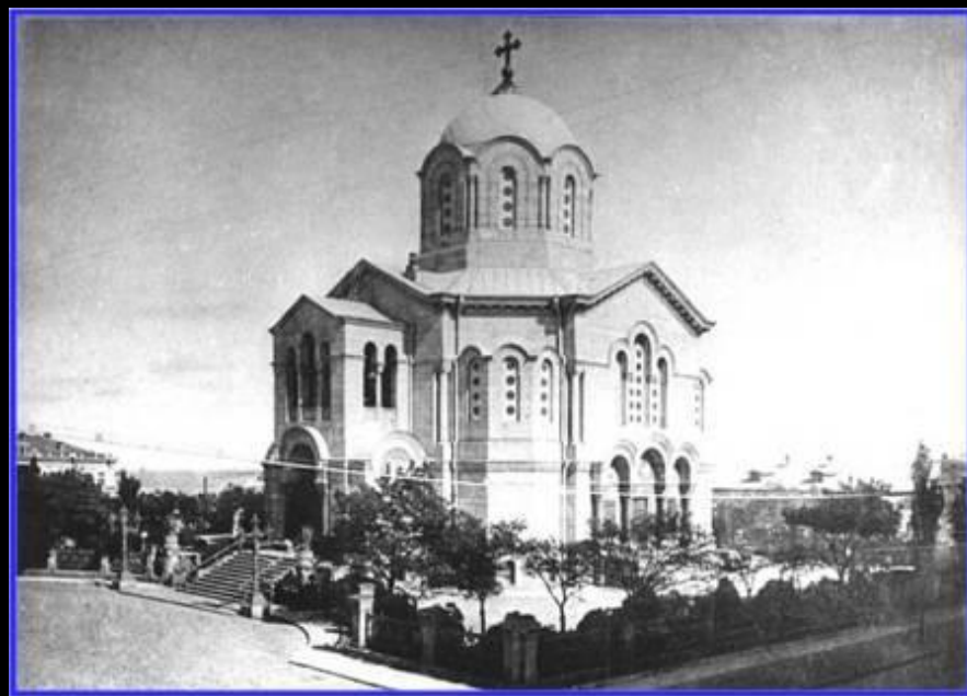
Владимирский собор (1854-1888 гг.) Архитектор К.А. Тон)