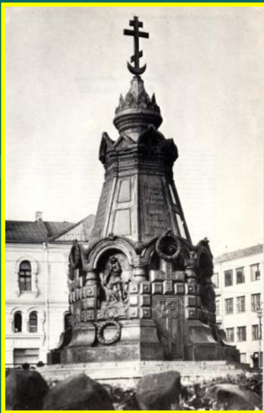
Часовня павшим в боях за Плевну (архитектор В.О. Шервуд), г.Москва