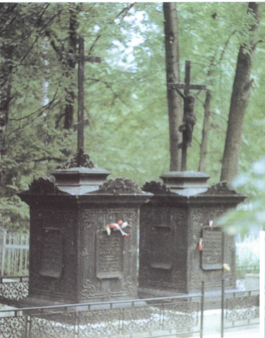
Надгробия декабристов в Тобольске