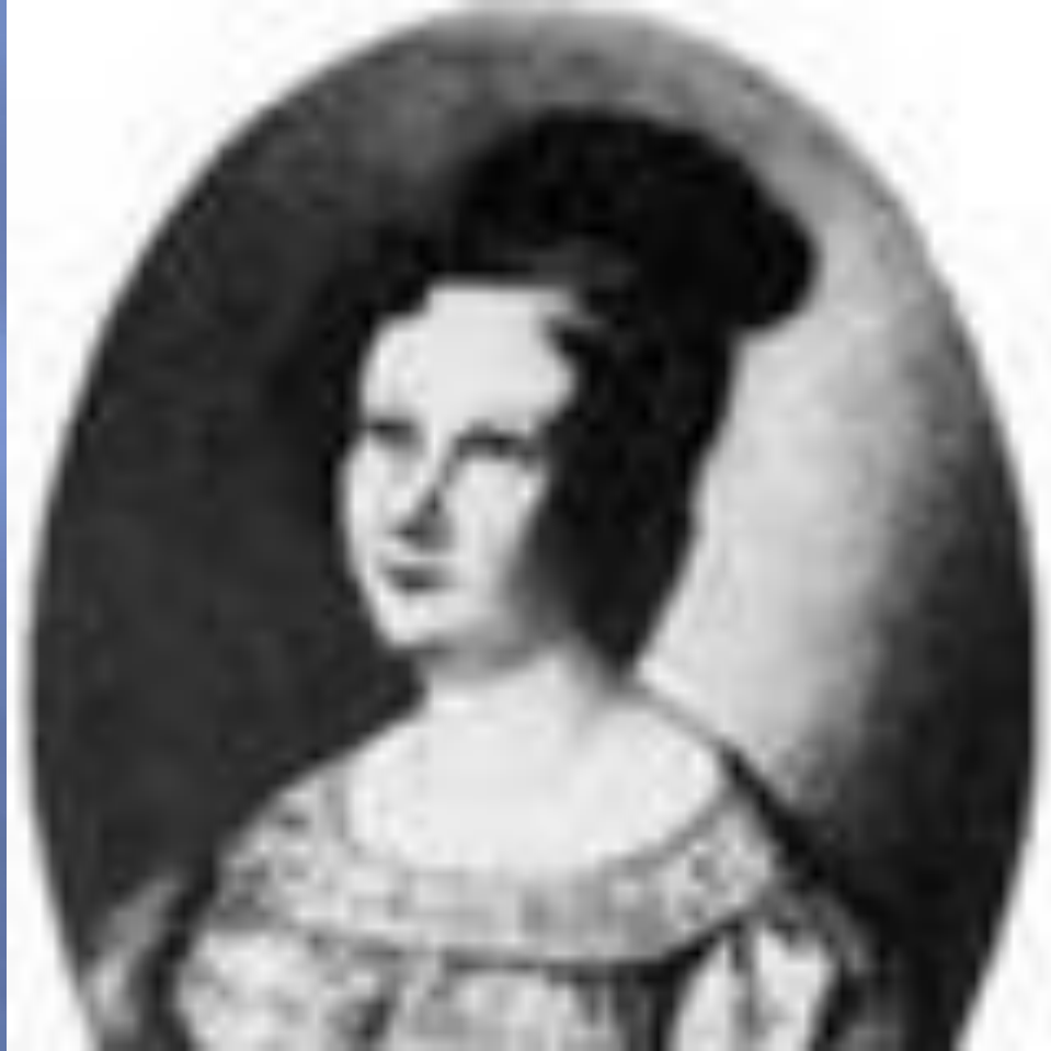
ТРУБЕЦКАЯ (Лаваль) Екатерина Ивановна (1800-1854)