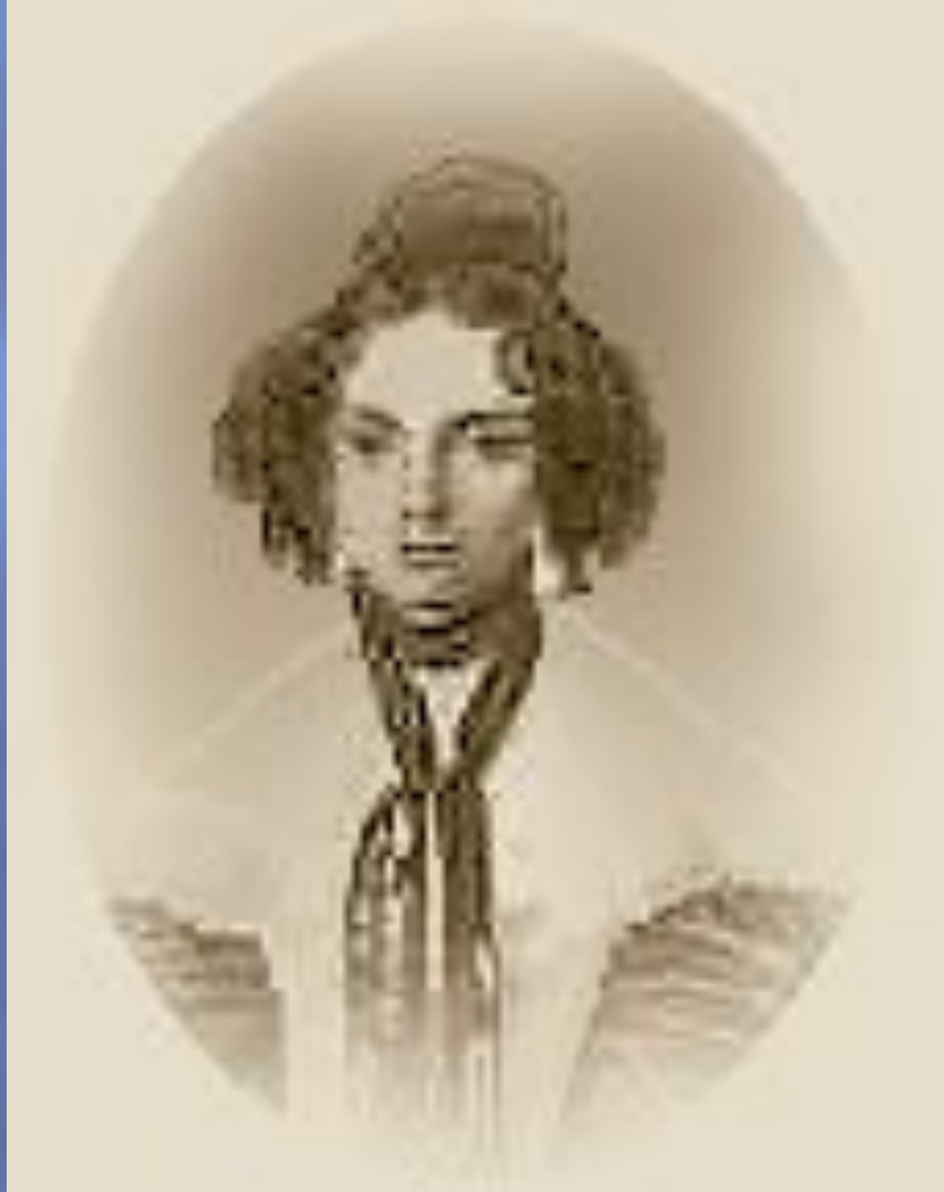
ВОЛКОНСКАЯ (Раевская) Мария Николаевна (25.12.1805/7 - 10.08.1863)