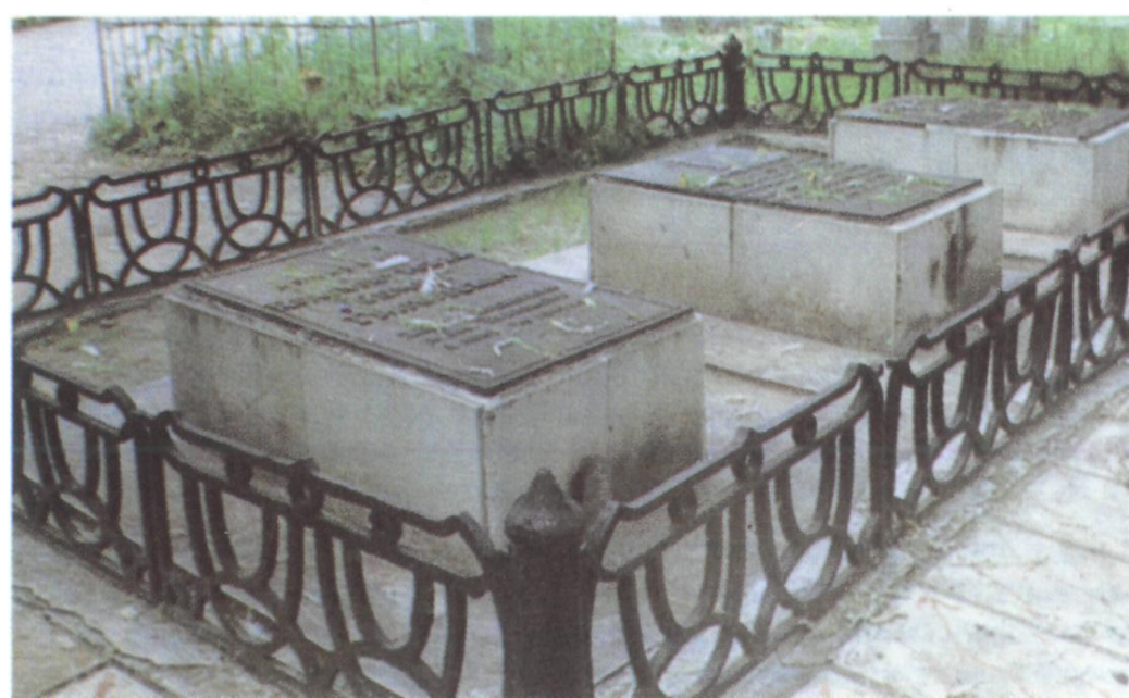
Памятники Муравьёву и Вольфу