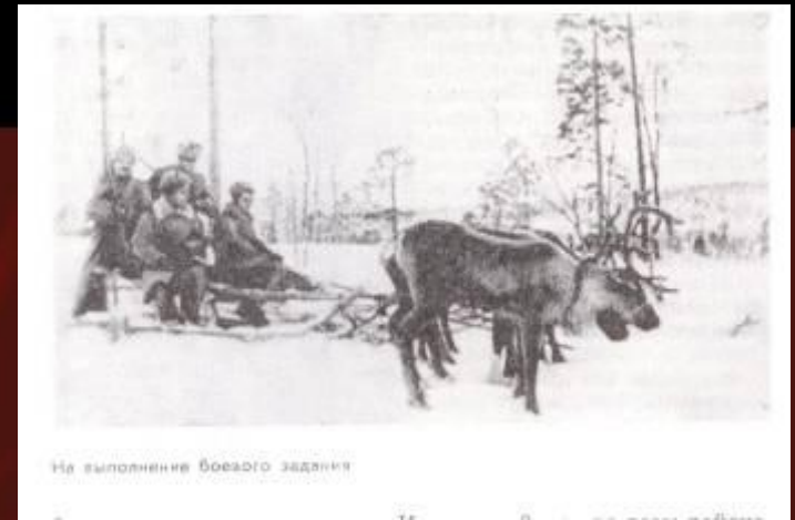
На выполнение боевого задания