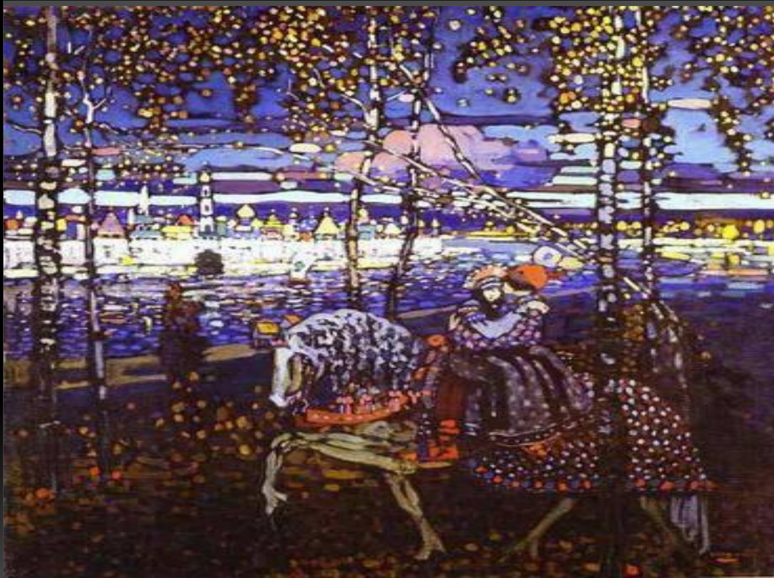
Кандинский Василий «Двое на лошади» 1906 г.