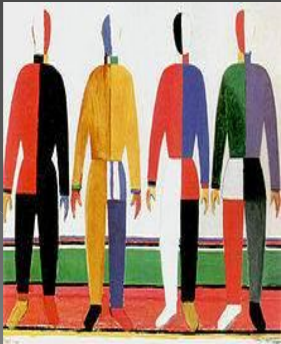
Казимир Малевич «Атлеты» 1933г.