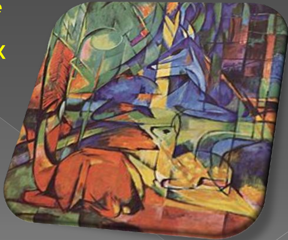
Франц Марк «Олени в лесу».