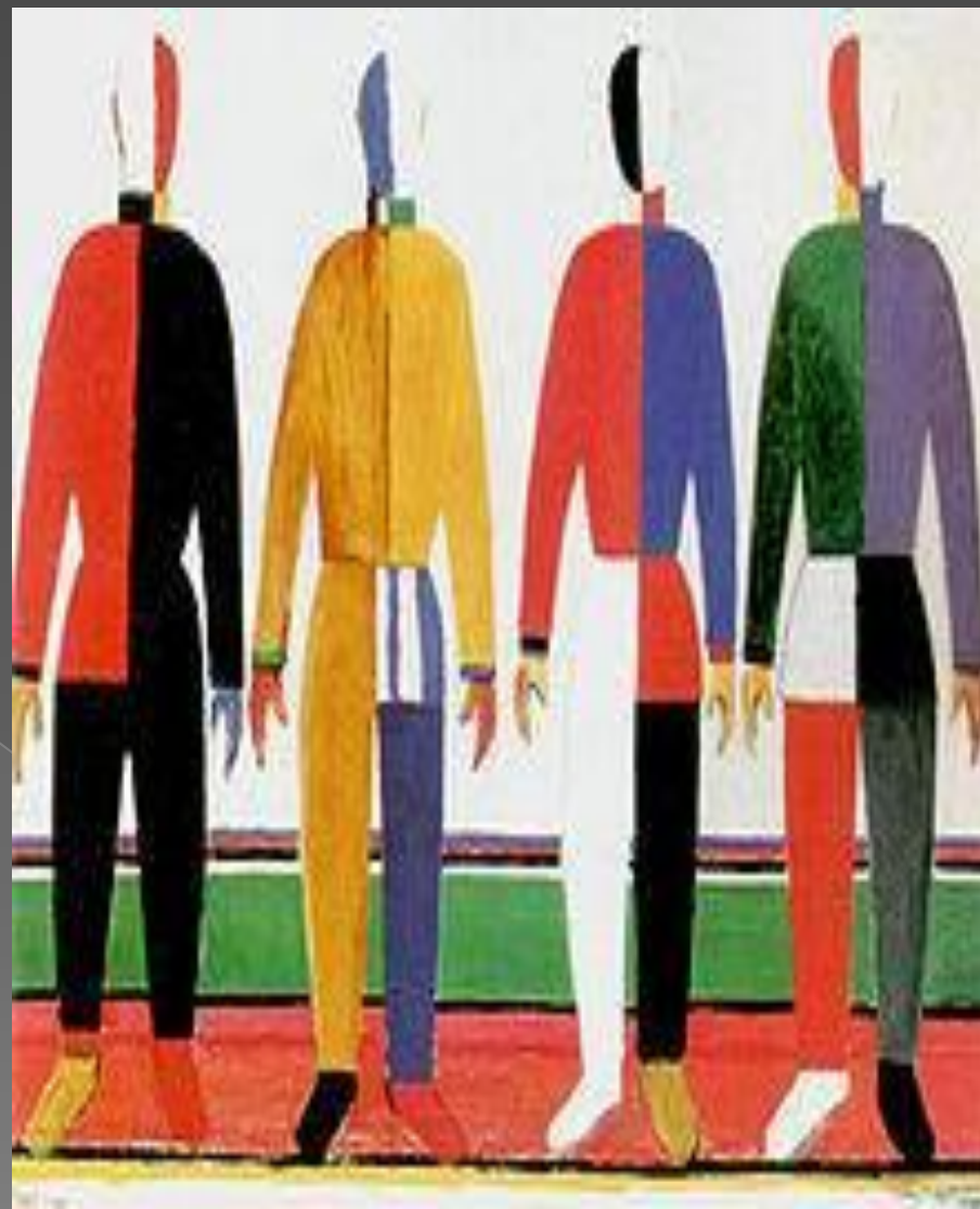
Казимир Малевич «Атлеты» 1933г.