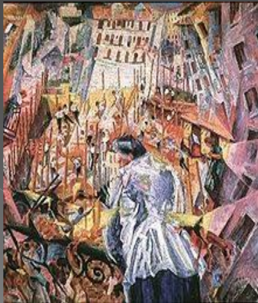
Умберто Боччони «Улица входит в дом» 1911г.