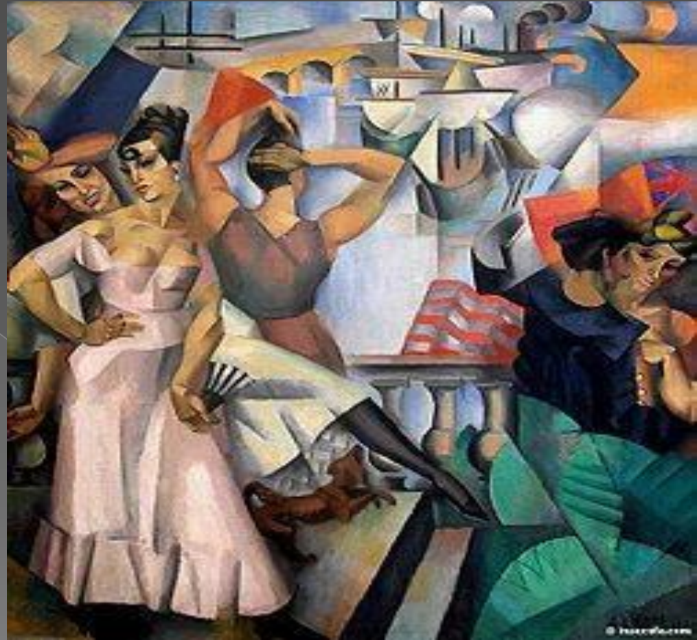
Андре Лоте «Париж»