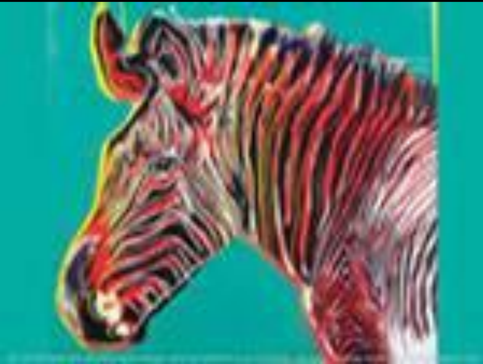
Энди Уорхол «Зебра» 1983г.