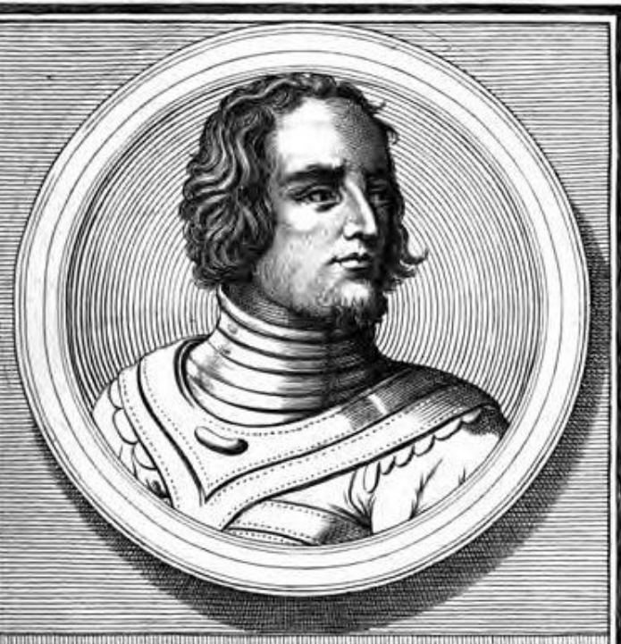
ALARICO SEGUNDO REY DE LOS GOTOS, ELEGIDO EN EL AÑO 382 D CHRISTO, REYNÓ 28 AÑOS MURIÓ EN CA- LABRIA EL AÑO 410.

Мечтая завладеть сокровищами Рима, Аларих, вождь германского племени готов двинул свои войска на Рим. К ним стали присоединяться рабы и колонны, показывали готам тайники, где римляне прятали хлеб и оружие.