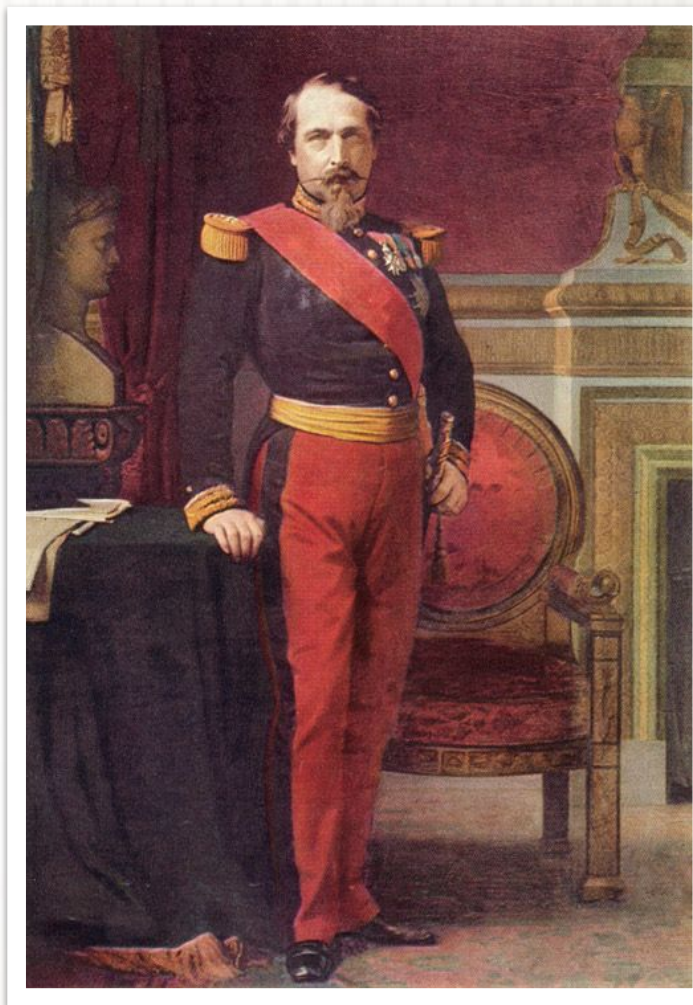
Луи Наполеон Бонапарт