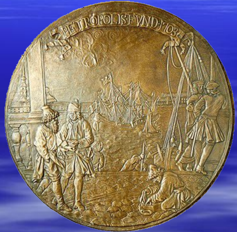
барельеф «Основание Петербурга» скульптор К. Растрелли, XVIII в.

16 мая 1703 года была заложена Петропавловская крепость на острове Люст – Эйланд (Весёлый). Эта дата считается днём рождения. Санкт-Петербурга, в этом же году и закончилось её строительство.