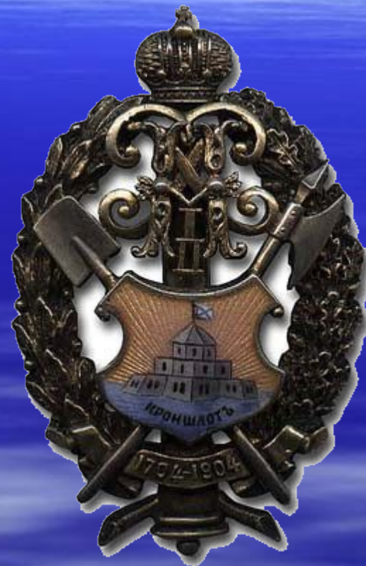
Знак 200 лет крепости Кроншлот

Пётр Первый придавал этой крепости огромное значение. В инструкции коменданту Кроншлота говорилось: «Содержать сию цитадель с Божьей помощью, аще случится, хотя до последнего человека... Зело надлежит стеречься неприятельских брандеров. При приближении к крепости нейтральных кораблей давать по ним предупредительный выстрел, чтобы опустили паруса и бросили якорь; в случае неповиновения открывать огонь». В годы Северной войны войска Кроншлота не раз отражали нападения шведского флота. Пётр утверждал, «что неприятель в море близко появиться не смеет... В Петербурге спать будем спокойно».