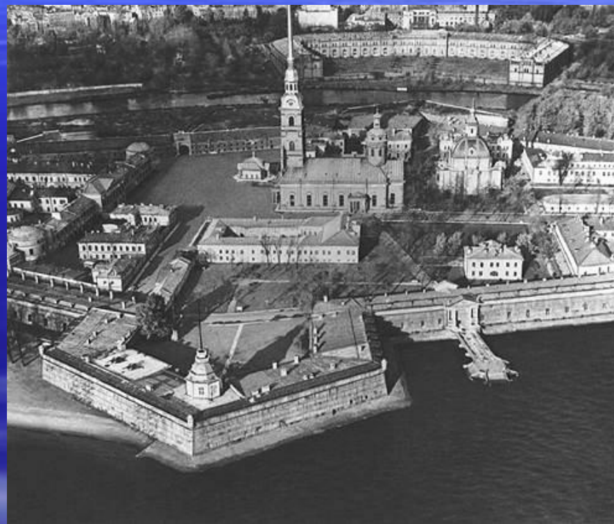
Петропавловская крепость, Нарышкинский бастион и Коммандантская пристань

Работа по строительству древо-земляной крепости руководил А. Д. Меншиков. За возведением каждого из шести бастионов царь приказал следить своим сподвижникам и приближённым. Один из бастионов, юго-восточный, назван в честь самого царя, а другие бастионы до сих пор носят имена его сподвижников: Нарышкинский (с 1726 г. - Екатерининский), Трубецкой, Зотов, Головкин (с 1730 г. - Аннинский), Меншиков (с 1729 г. - Петровский).