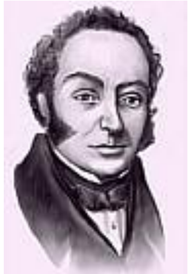
Фергюс О, Коннор (1796-1855)