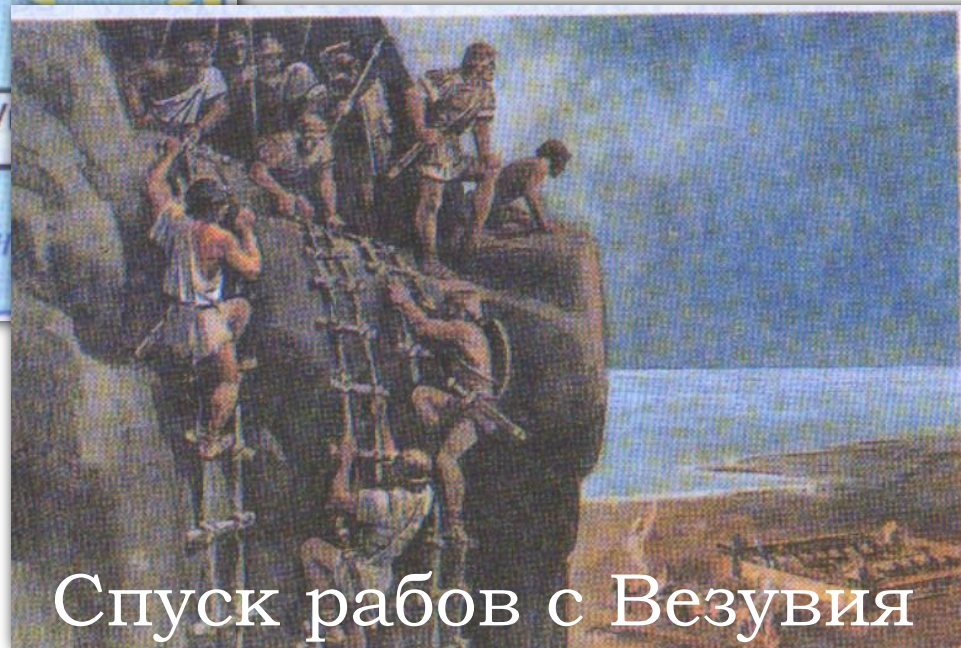
Спуск рабов с Везувия