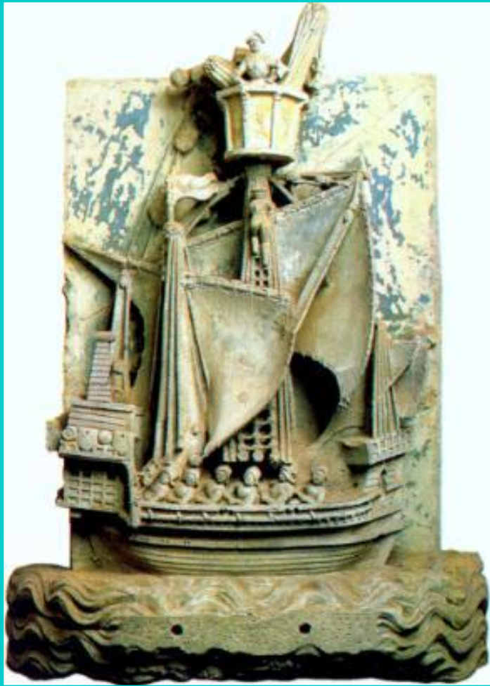
Морская торговля. Барельеф 14 века.

Несмотря на натуральный характер феодального хозяйства, торговля не только не исчезла но и приносила прибыль.