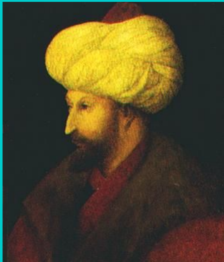
Махмуд II Завоеватель.

В сер. 15 в. на престол вступил Махмуд II Завоеватель, умертвив несколько своих родственников.