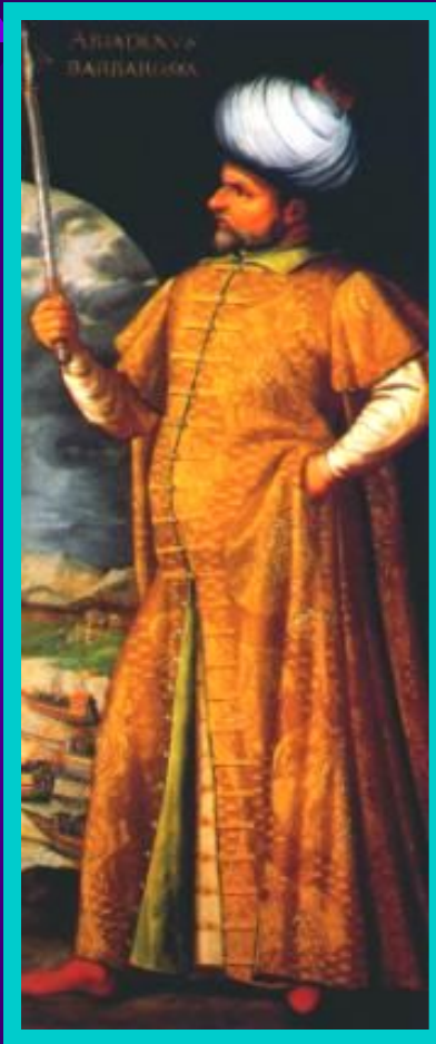
Адмирал Барберусс Кхаир-аль-Дин. Основатель турецкого флота.

В к.14 в. султан Баязид усилил давление на Византию. Он построил большой флот и блокировал Константинополь. В городе начался голод, жители умирали от холода из-за нехватки топлива.