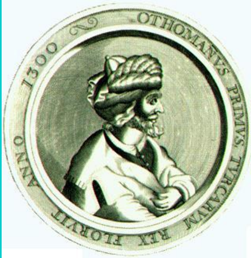
Осман I. Средневековая гравюра.

Турки воспользовавшись предложением стали самостоятельно совершать набеги на Балканы.