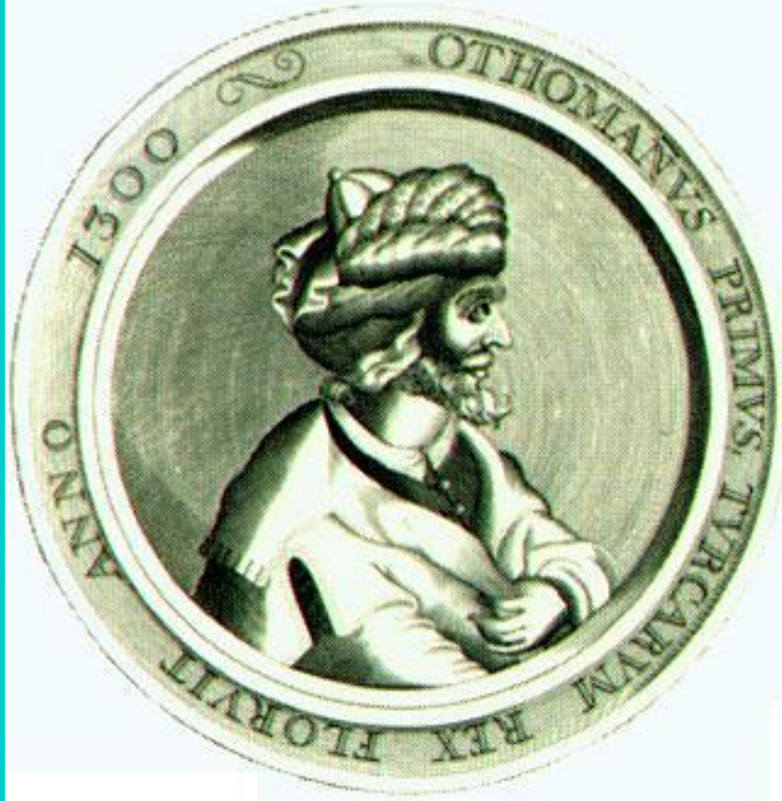
Осман I. Средневековая гравюра.

Турки воспользовавшись предложением стали самостоятельно совершать набеги на Балканы.