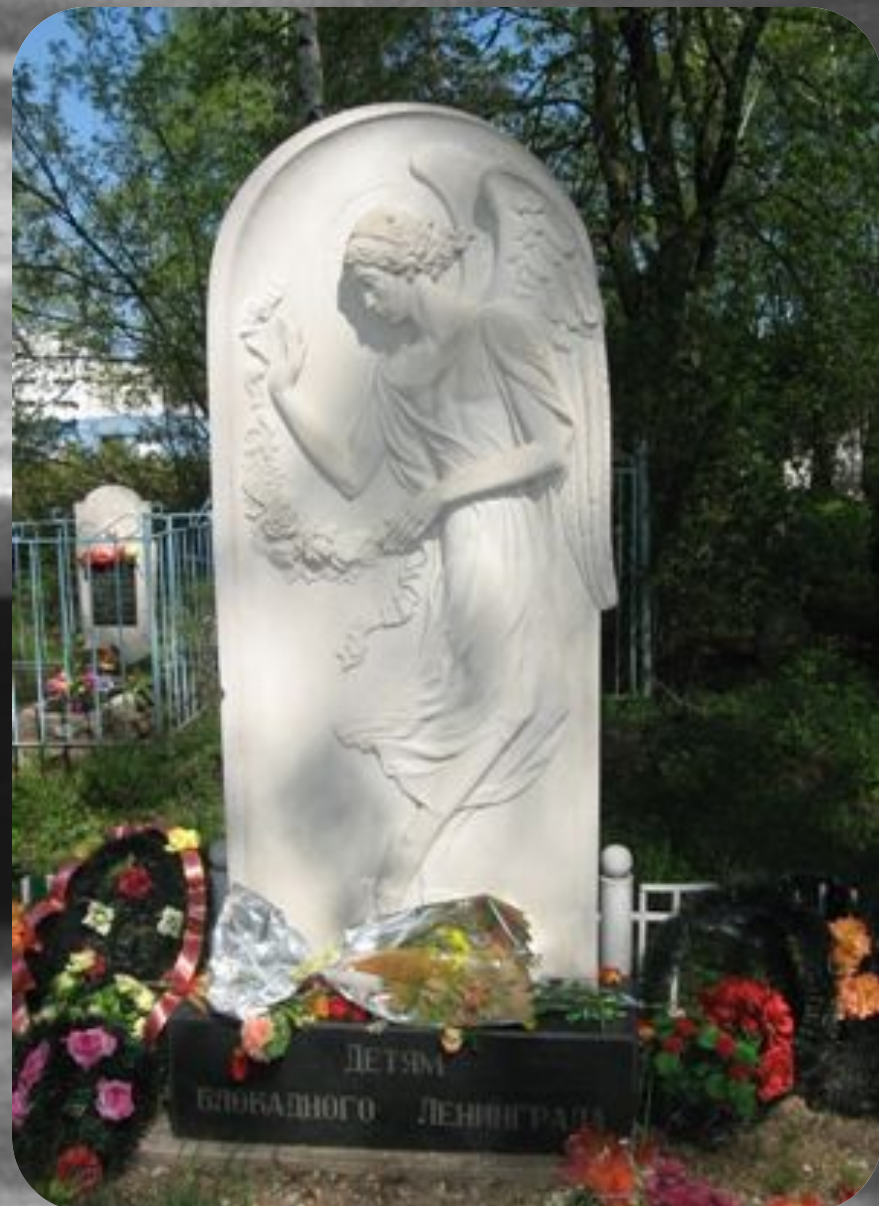
Памятник детям блокадного Ленинграда (Ярославль).