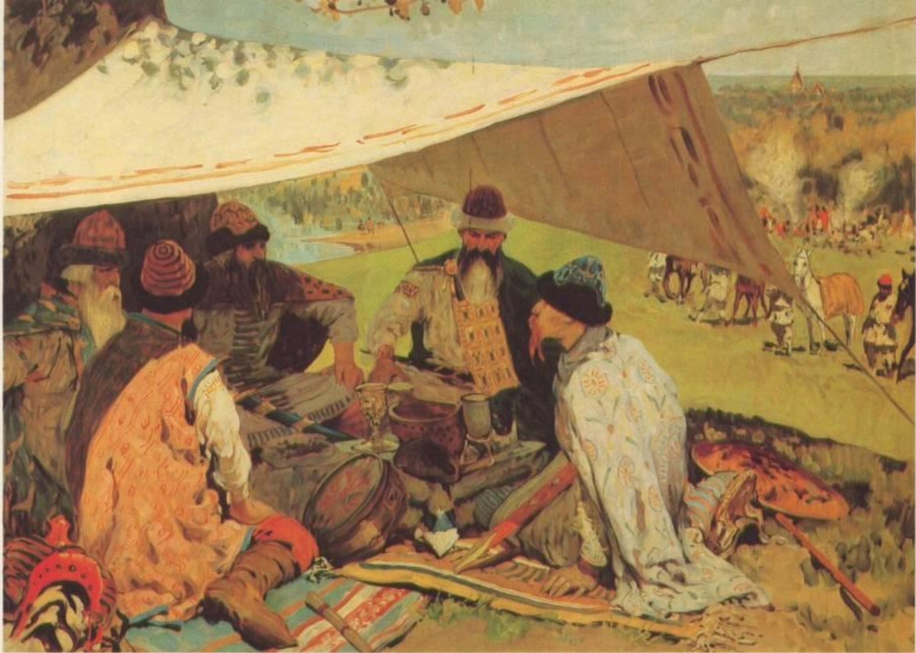
С. В. Иванов. Съезд князей