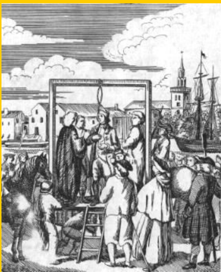
Казнь пирата в Лондоне. Гравюра 16 века.

Джон Морган занимался своим промыслом в Карибском море. Под его началом состояли несколько флотов. С Морганом воевали несколько государств. Особенно от английских пиратов страдали испанцы. Англичане поддерживали Моргана, а губернатор Ямайки был его другом. Затем Морган стал вице-губернатором Ямайки и добился успеха в преследовании своих бывших товарищей-пиратов.