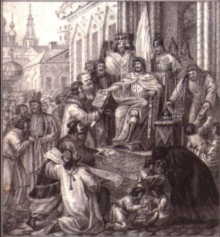
ЯРОСЛАВЪ ЗАКОНОДАТЕЛЬ 1019 - 1054

Ярославъ издасть письменные законы, подъ названіемъ Русской правды.