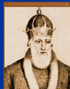
Владимир Красное Солнышко (Святой) (980-1054)