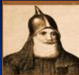
Рюрик (Новгород) 862-879