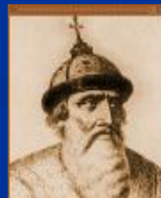
Владимир Мономах (1113-1125)