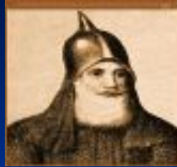
Рюрик (Новгород) 862-879