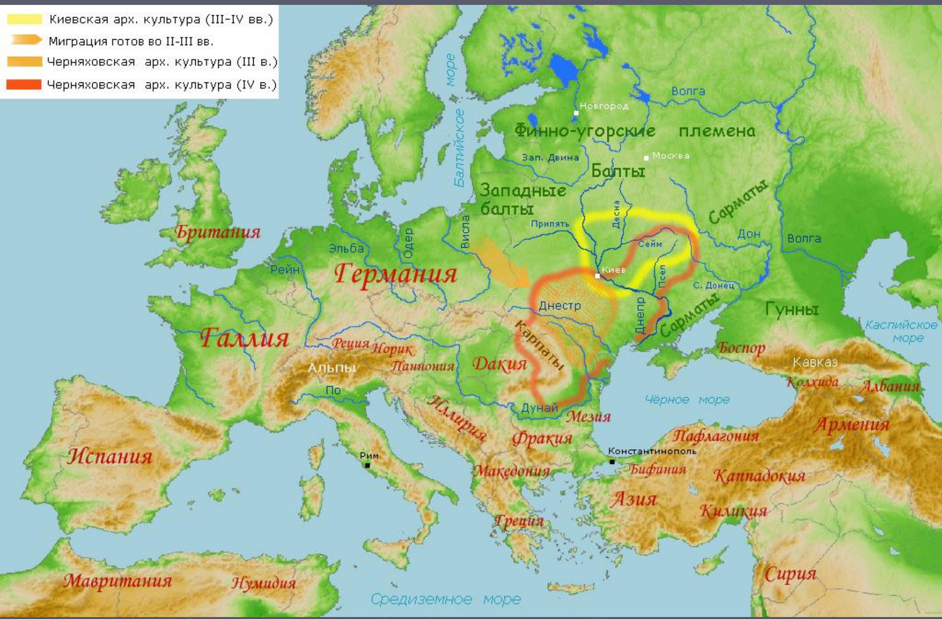
Славянские археологические культуры