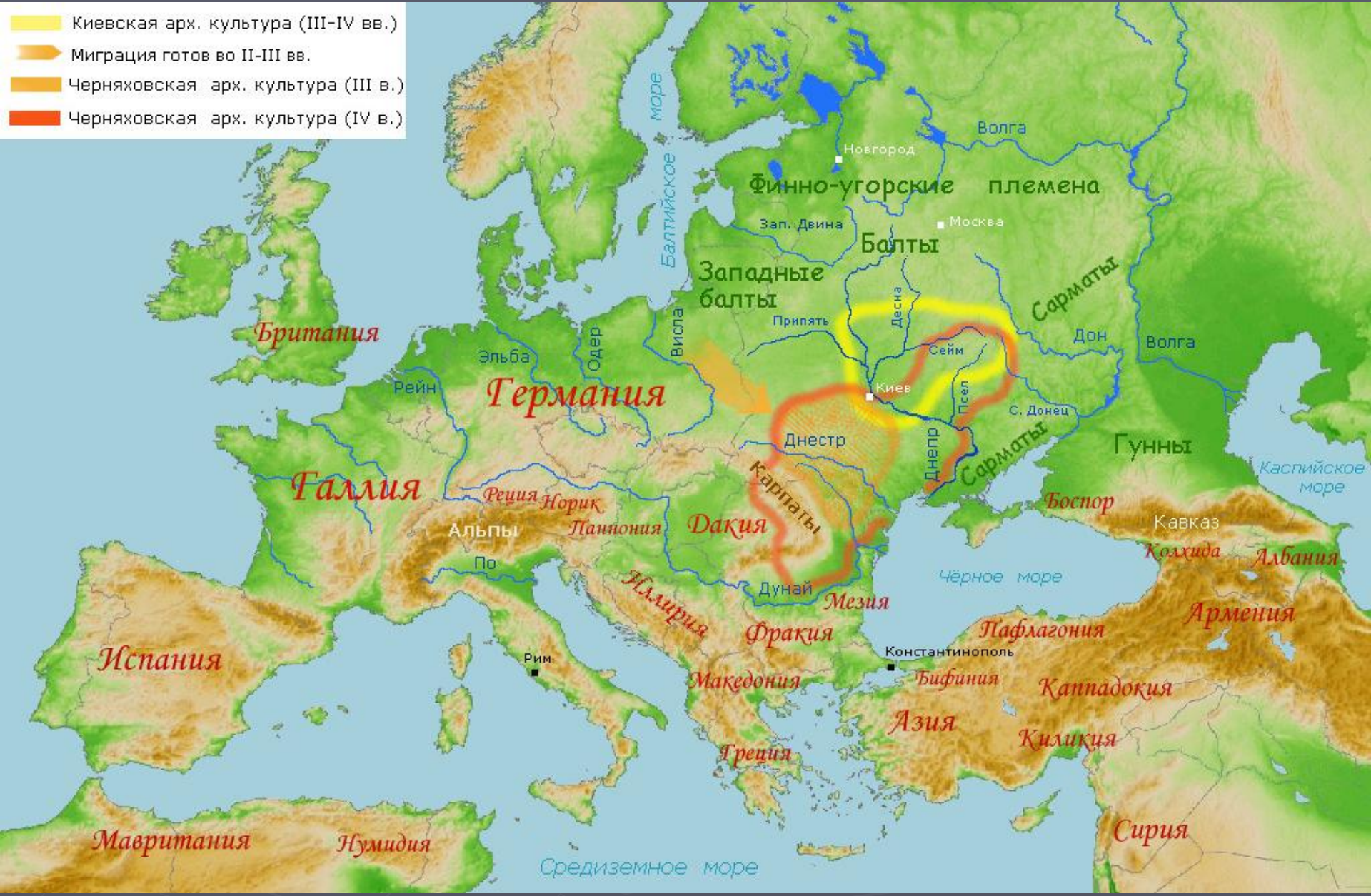
Славянские археологические культуры