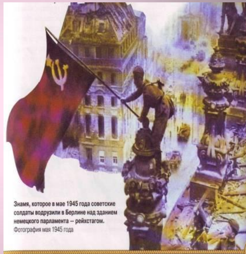
Знамя, которое в мае 1945 года советские солдаты водрузили в Берлине над зданием немецкого парламента – рейхстагом. Фотография мая 1945 года