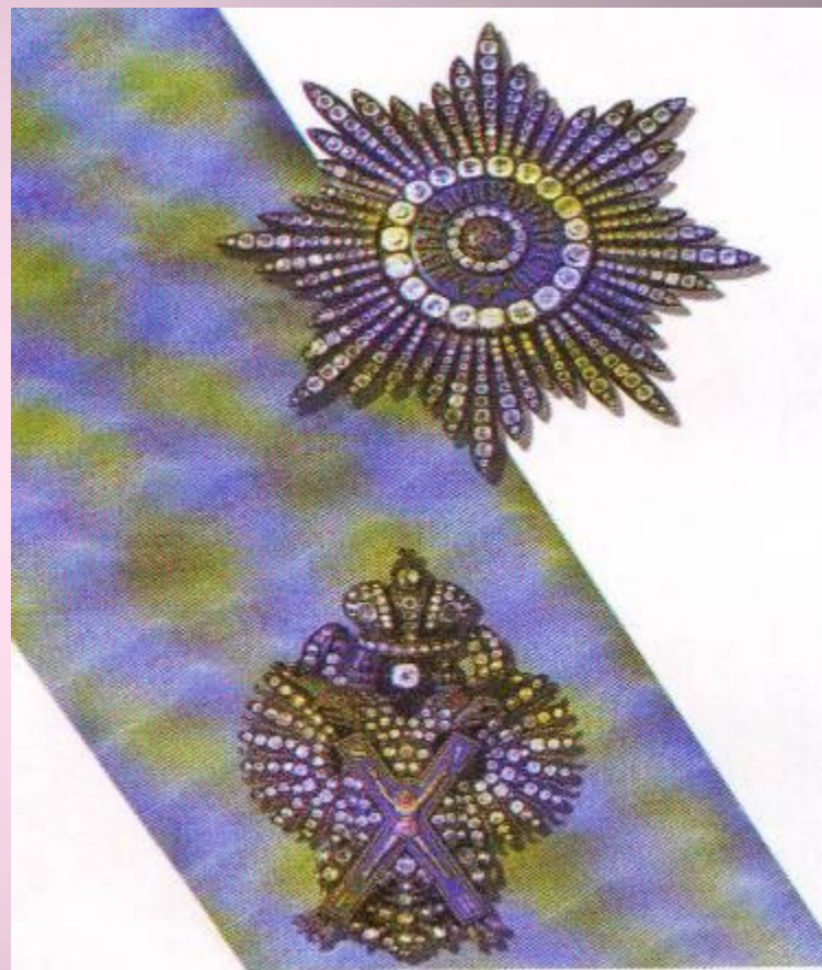
Орден Святого апостола Андрея Первозванного: знак, лента, звезда