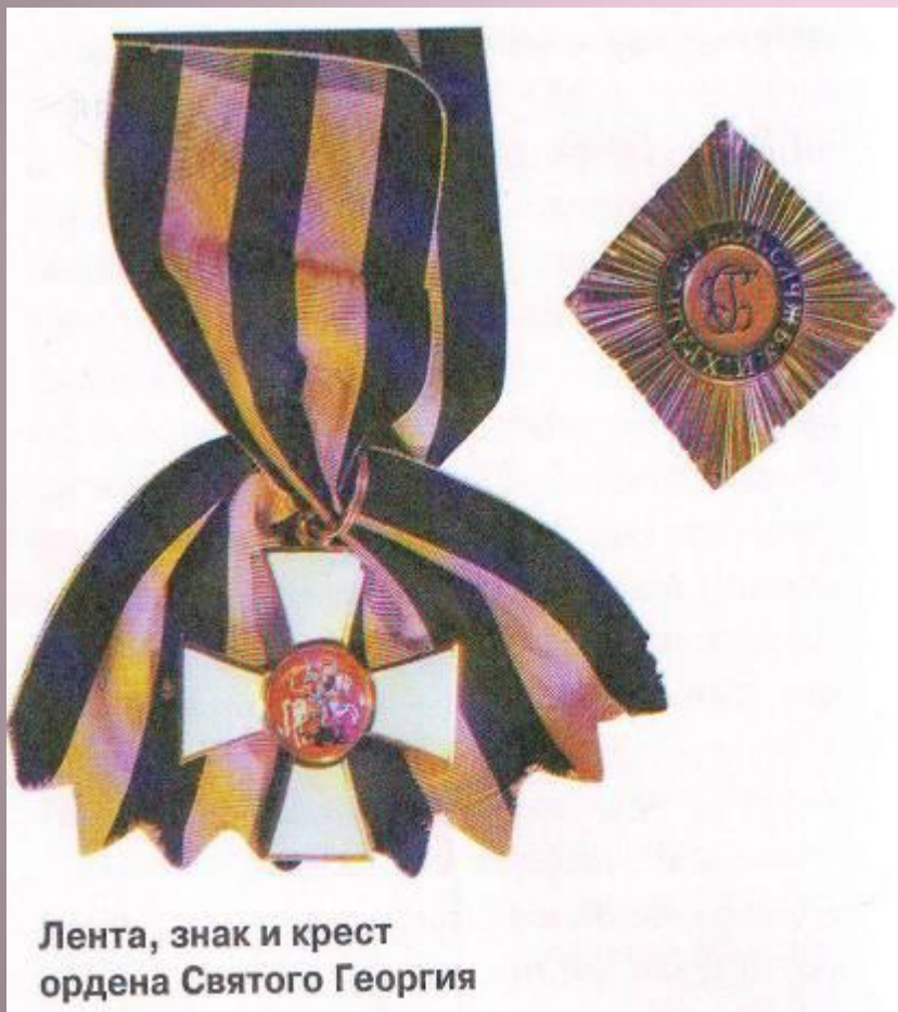
Лента, знак и крест ордена Святого Георгия