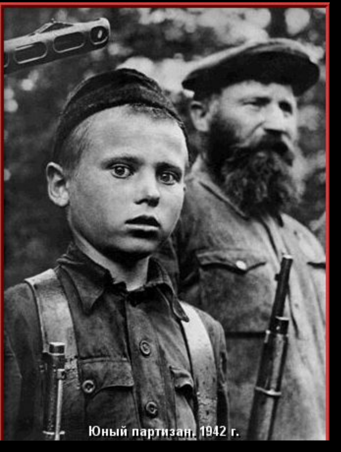
Юный партизан. 1942 г.