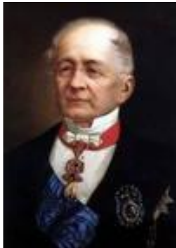
А. М. Горчаков

1) Используя противоречия между государствами, на международной конференции в Лондоне в 1871г. Россия получила разрешение строить крепости на Черном море и иметь там флот ( 1856г. -министр иностранных дел А. М. Горчаков, лицейский друг Пушкина, один из блестящих русских дипломатов, внешняя политика-"собрание сил").