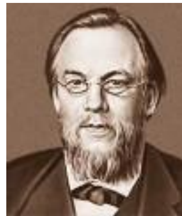
С. П. Боткин