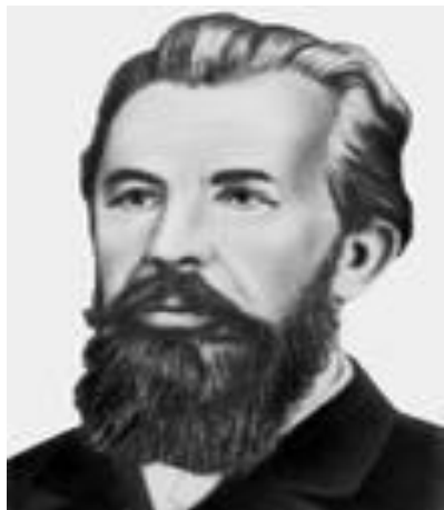
Н. В. Склифосовский

Общественные движения в России в защиту славяно-добровольцы, пожертвовавния, Александер II внес 10 тыс., хирург Н. В. Склифосовский возглавил санитарные отряды в Черногории, врач С. П. Боткин в Сербии.