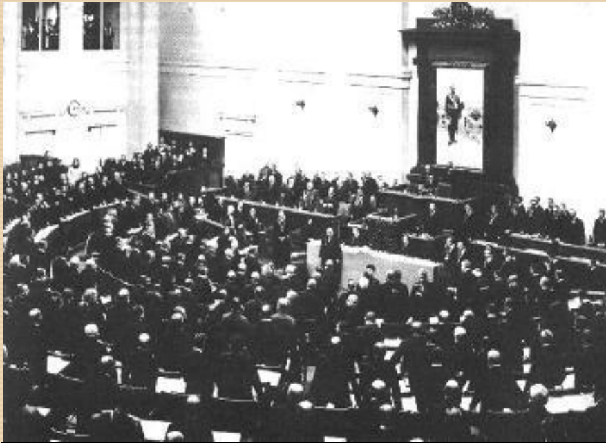
III Дума обсуждает «финский» вопрос.

В Думе предпринимались попытки ликвидировать права окраин, дарованные во время революции. В 1909 г. образовалась фракция националистов, ставшая опорой Столыпина. В 1910 г. Дума приняла закон, фактически урезавший финскую автономию. В ответ на протесты финнов, Николай II распустил финский Сейм.