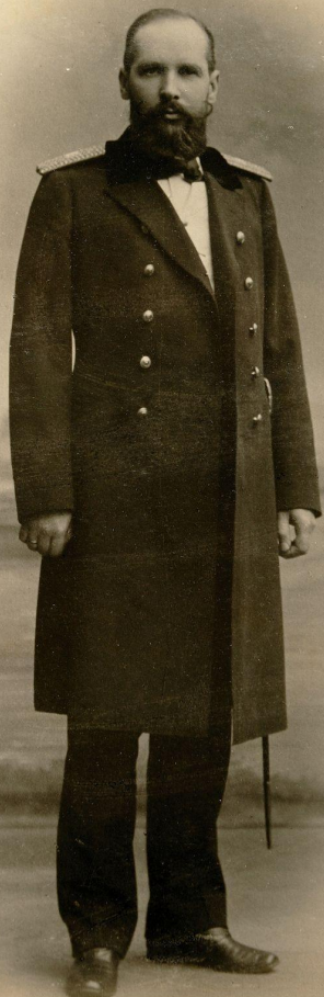
П. А. Столыпин — Гродненский губернатор, в 1902 г.