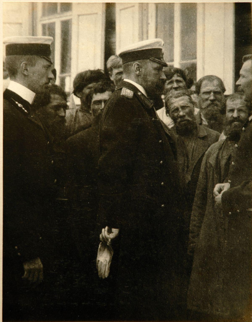
П. А. Столыпинъ — въ селѣ Булгаковѣ Вольскаго уѣзда, въ Юлѣ 1904 г.

« Дайте государству 20 лет покоя внутреннего и внешнего, и вы не узнаете нынешней России»