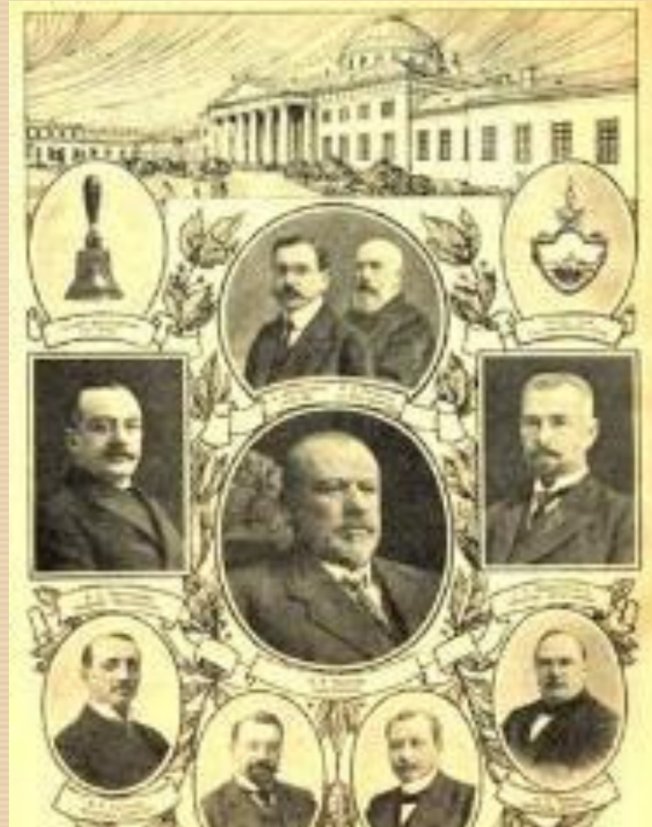
Президиум IV Думы.