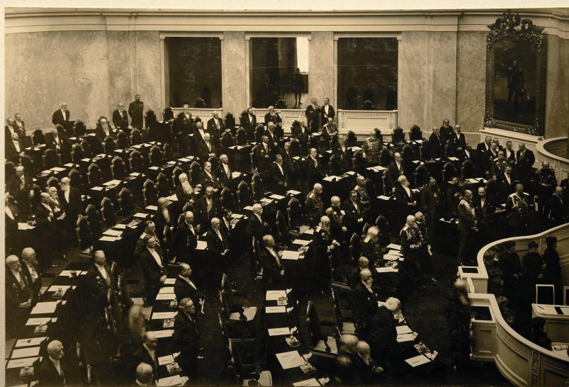
П. А. Столыпин в Государственном Совете на открытии заседаний в новом зале Маринского Дворца.

3 июня 1907 г. был создан новый избирательный закон, сохранивший деление на 4 курии. Но изменилось число выборщиков в пользу землевладельцев.