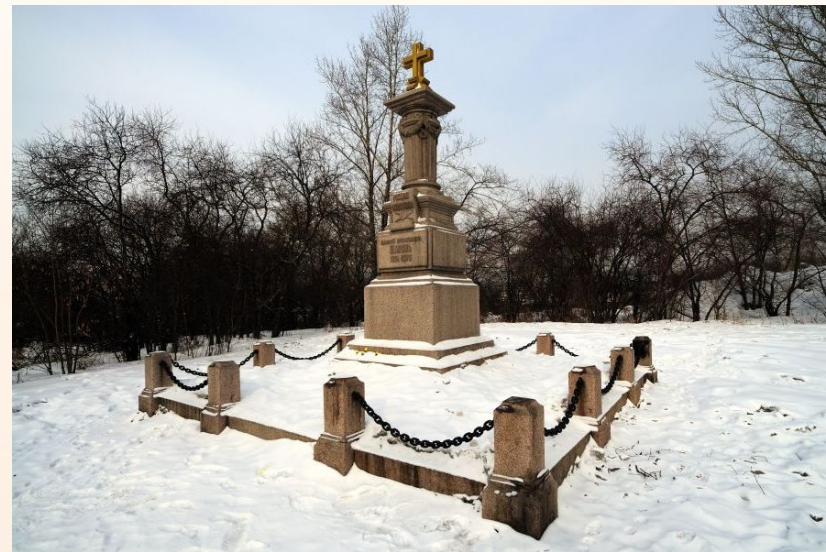
Памятник Афанасию Шапову на Знаменской горе в Иркутске