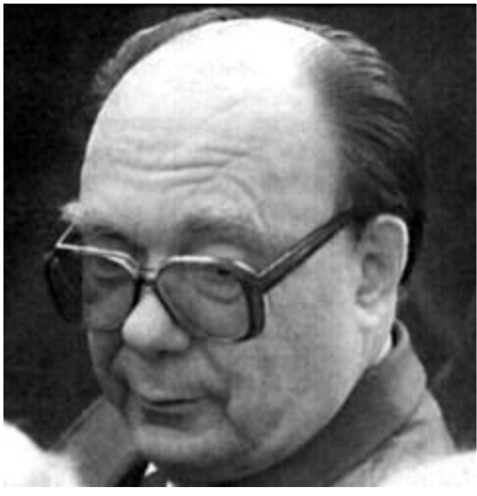
Секретарь ЦК КПСС по идеологии А.Н.Яковлев.

Гласность привела к переосмыслению прошлого. В печати были подняты «закрытые» прежде темы, критике подверглись ближайшие соратники Ленина.