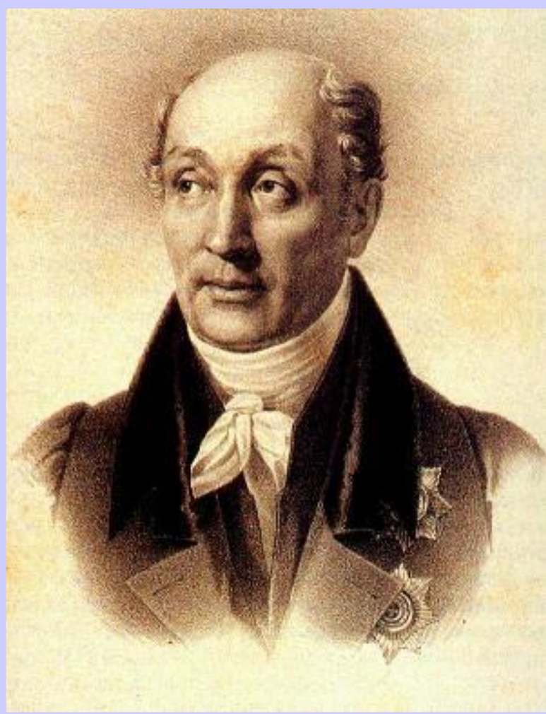
М.М. Сперанский в 1812 г.

В 1810г. был создан Гос. Совет, который должен был рассматривать все законопроекты и рассматривать отчеты министерств. Сперанский был назначен госсекретерем.