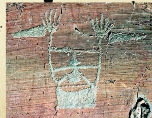
Долина чудес (Франция)