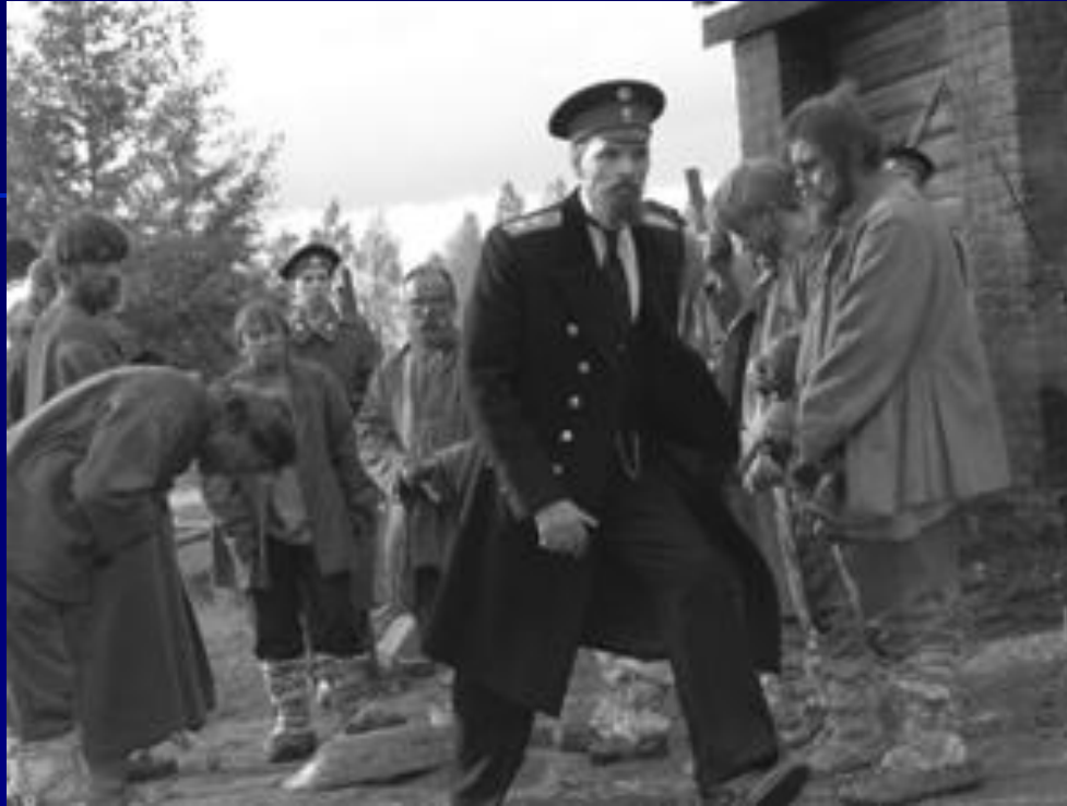
Столыпин осматривает хуторское хозяйство.