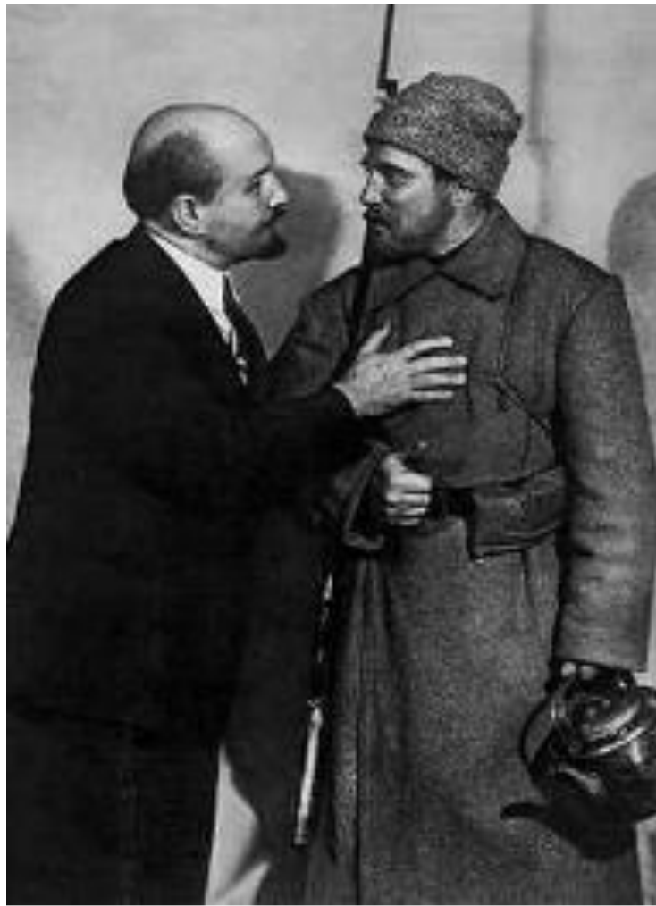
Б.Щукин в роли Ленина В спектакле «Человек с ружьем»

В к. 20-х гг. на сценах советских театров начинают утверждаться пьесы советских драматургов. «Человек с ружьем» Н.Погодина, «Оптимистическая трагедия» В.Вишневского, «Таня» А.Арбузова – составили «золотой фонд» репертуара многих театров.