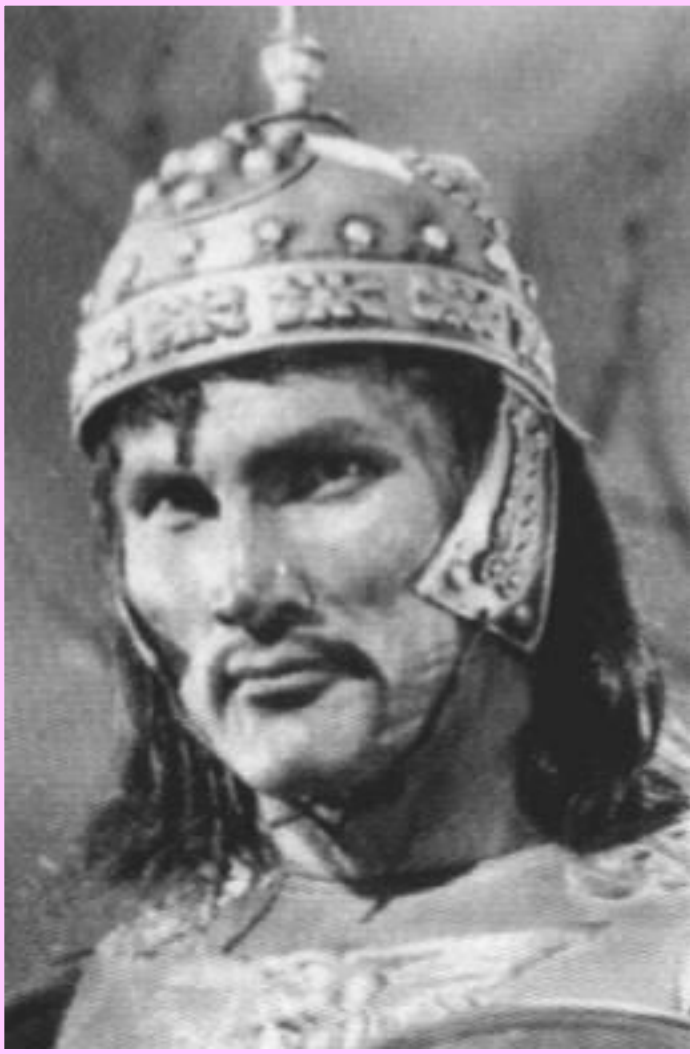
Аттила. Кадр из испанского кинофильма. 1954 г.

? Помните, как назывались кочевники взявшие Рим ?