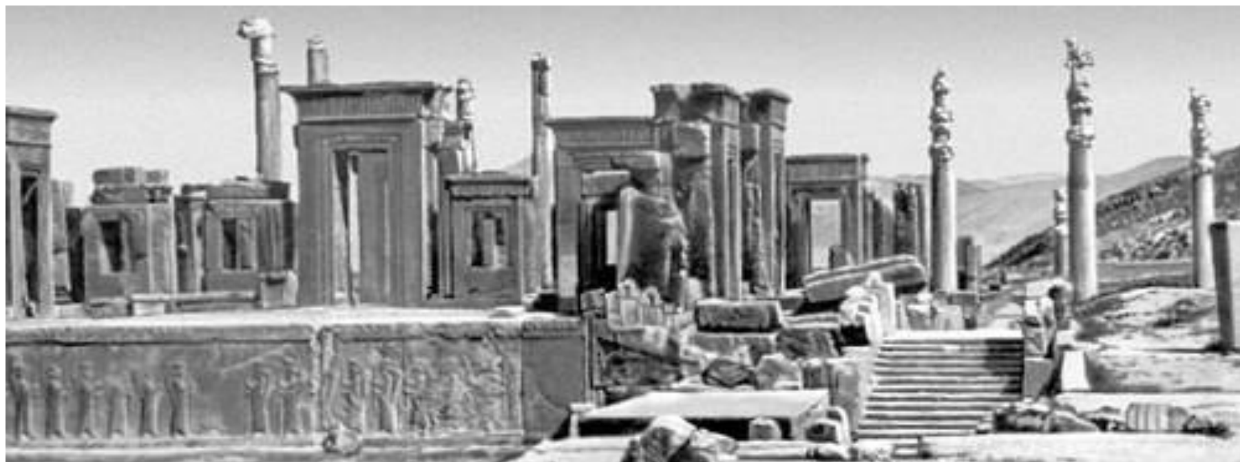
Персеполь- столица Персии