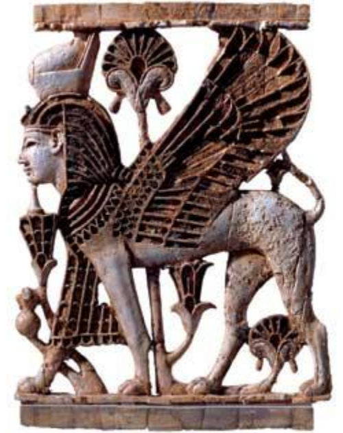
Украшение трона царя