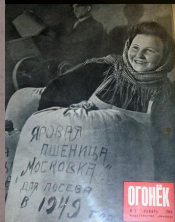
Фото из экспозиции Конаковского Краеведческого музея