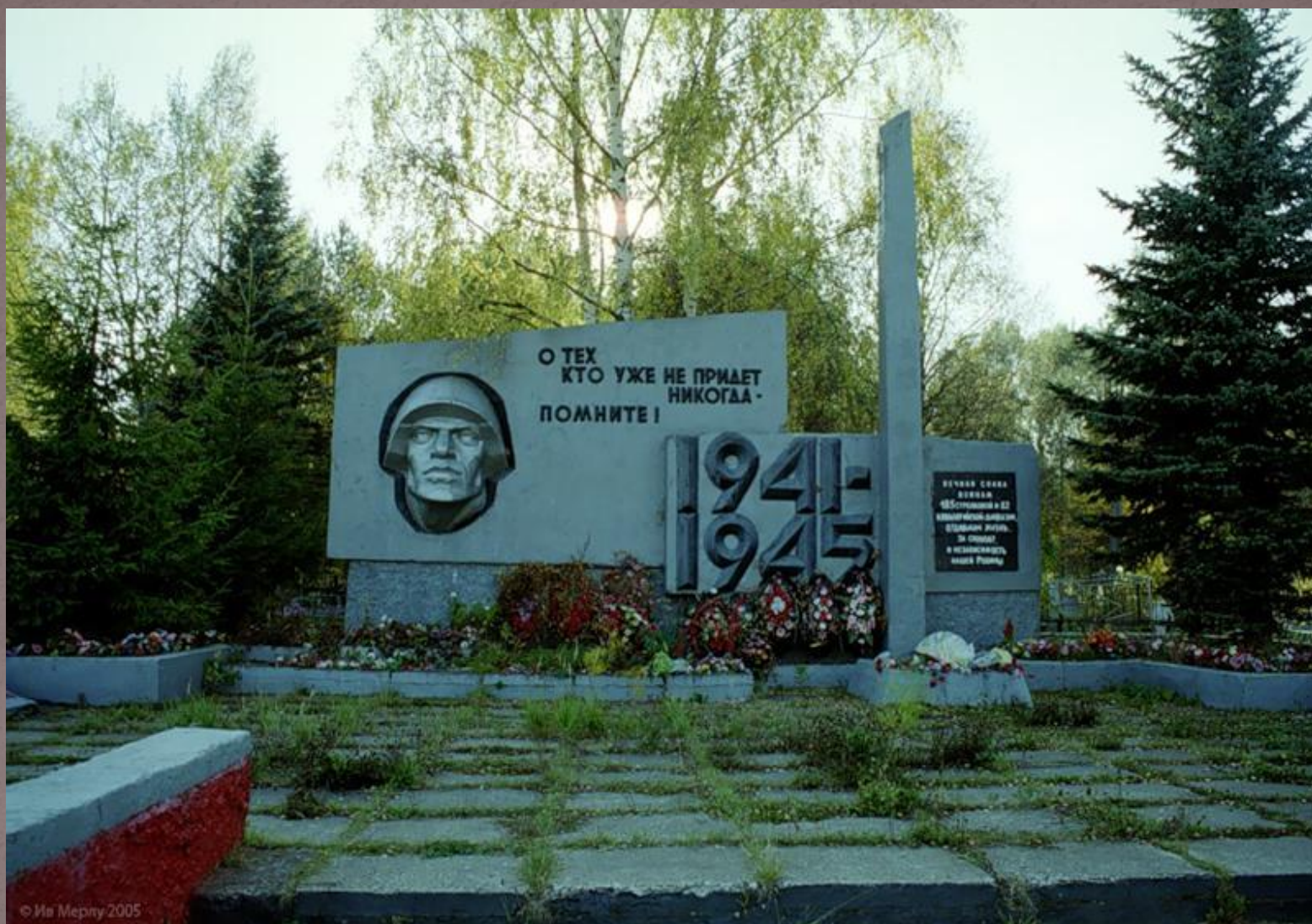
Мемориал в с. Селихово