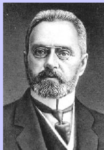
П.Н.Миллюков и А.И.Гучков

Кадеты опирались в основном на интеллигенцию. В это же время возник «Союз 17 октября» (А.И.Гучков). Октябристы добивались единства России, неприкосновенности частной собственности, уравнивания крестьян в правах с др. сословиями, наделение их участками за счет продажи государственных земель, ограничение стачек и введение рабочего законодательства. Октябристы опирались на крупную буржуазию и поме-