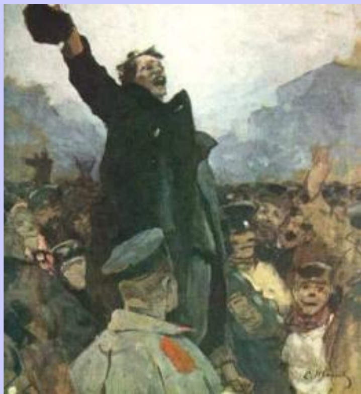
С.Иванов. 17 октября 1905 г. Митинг.

17 октября 1905 г. Николай II подписал манифест «Об усовершенствовании государственного устройства». Он вводил в стране политические свободы, провозглашал выборы в Государственную Думу, становившуюся законосовещательным органом.