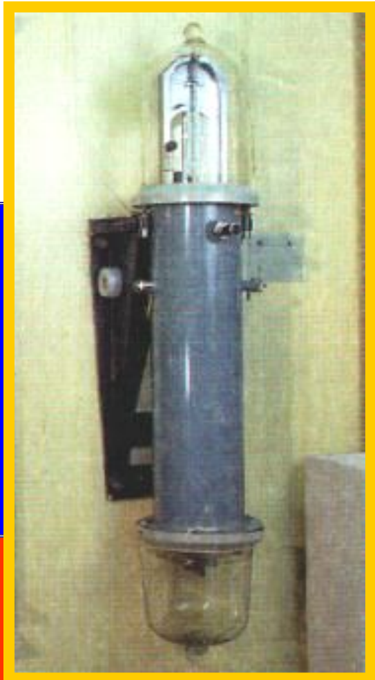
Астрономические электронные часы.

Самыми точными считаются электронные часы. В них для измерения времени используются различные типы излучателей с постоянной частотой. Эти часы используются там, где нужна особенно большая точность.