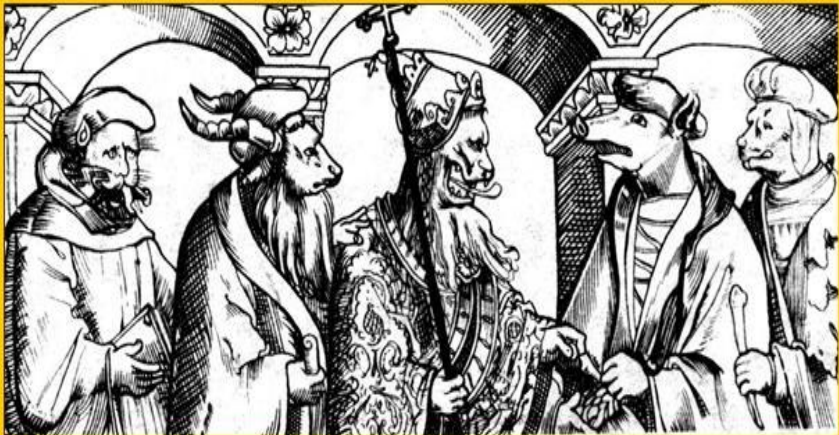
Папа римский и католические богословы