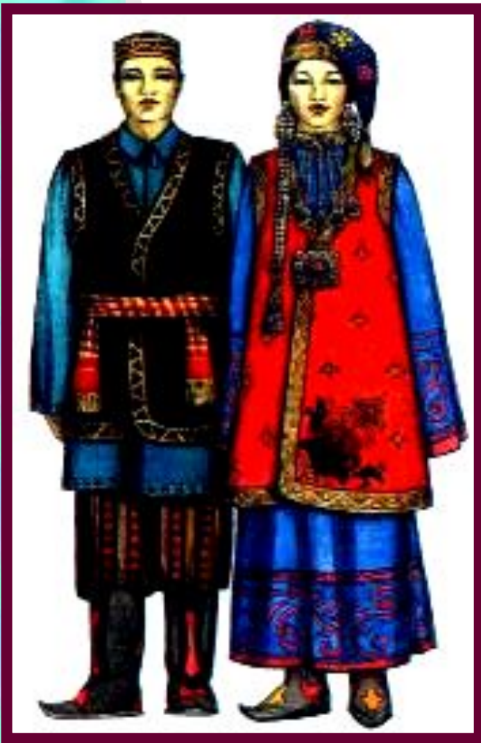
Татарский национальный костюм.

Покорение Поволжья и Приуралья завершилось в 17 в. Здесь возникли города (Уфа, Самара), прикрывавшие центр от набегов кочевников.