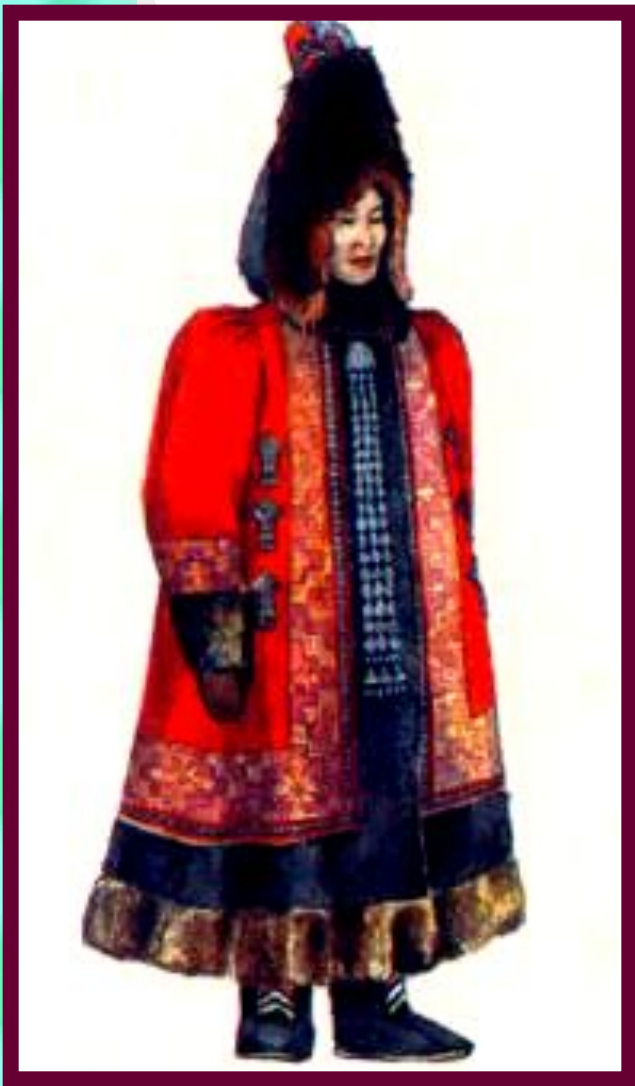
Якутская женщина в зимнем национальном костюме.

У Байкала жили буряты, разводившие крупный рогатый скот и занимавшиеся земледелием. Просо, гречиху и ячмень они обменивали у тунгусов на пушнину. В 17 в. у бурятов зарождается знать.