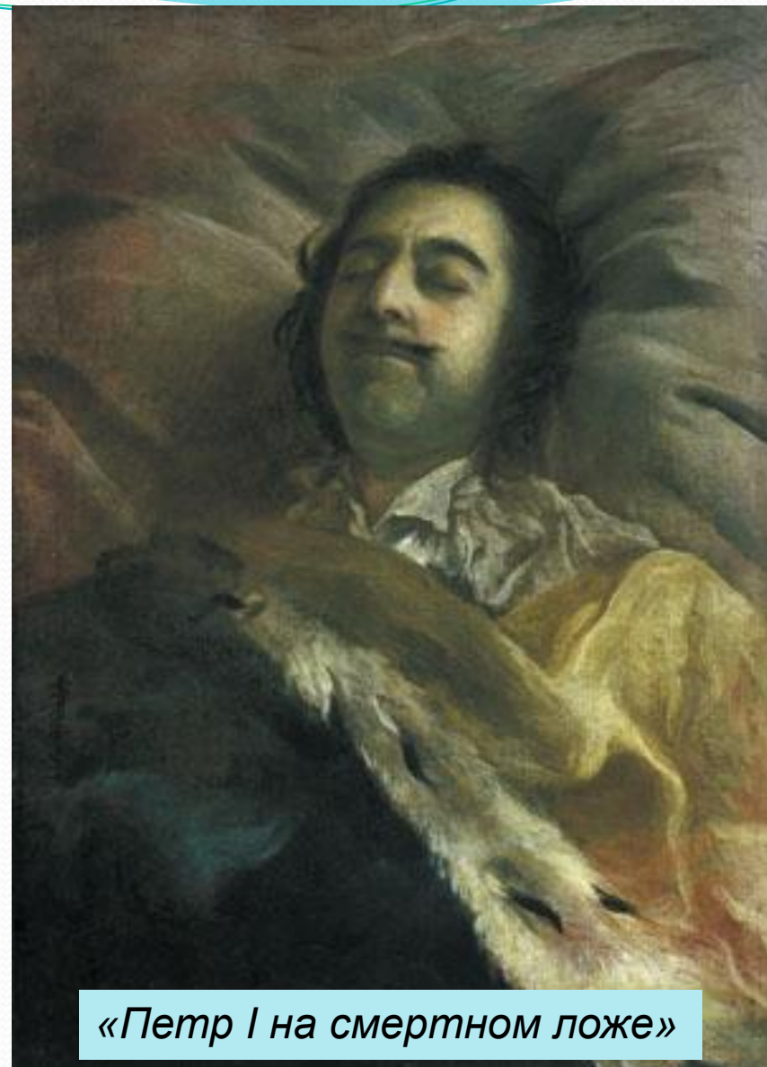
«Петр I на смертном ложе»

● Популярность приобрела портретная живопись . Основоположником русской светской живописи является Иван Никитич Никитин , обучавшийся в Италии. Его кисти принадлежат работы: « Напольный гетман », « Петр I на смертном ложе ». Ему присуще правдивое изображение героев, интерес к внутреннему миру человека, показ не только индивидуальных внешних черт, но и характера.