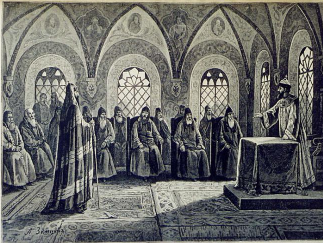
Русская история. Судъ надъ патриархомъ Никономъ. Ориг. рис. (собств. „Левъ“) А. Земцова, грав. Шоблеръ.