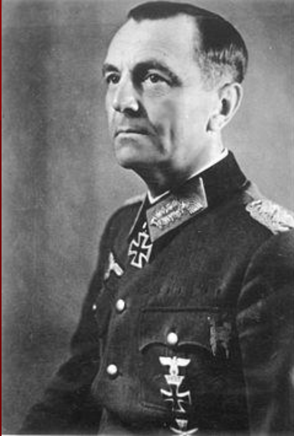
Александр Сив. ИСТОРИЯ Искусство. 1944 г. 1944 г.

Командующий 6-й германской армией генерал Паулюс