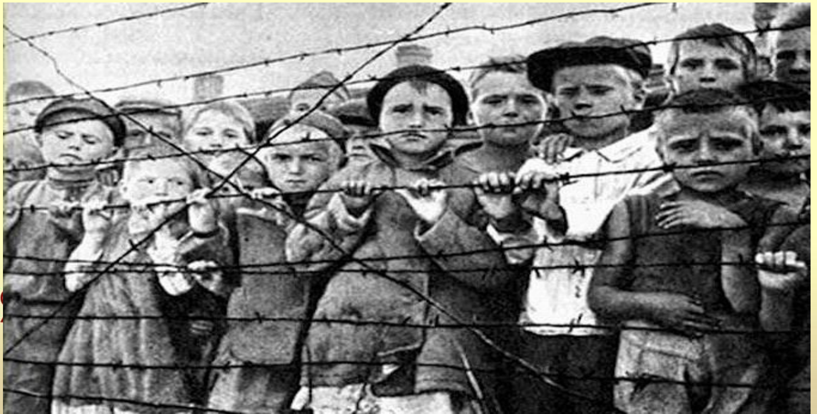
Голодные дети за колючей проволокой