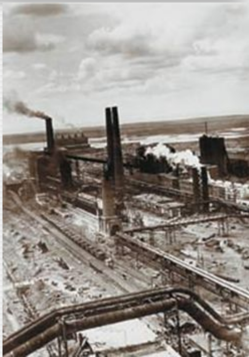
Магнитогорский металлургический комбинат, 1933

В годы первой пятилетки было введено в строй 1500 новых предприятий. На востоке страны появилась новая угольно-металлургическая база Урало-Кузбасс