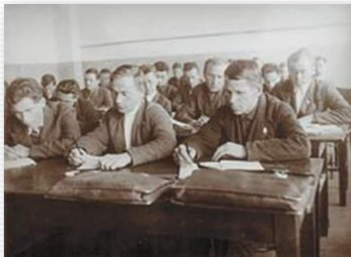
Слушатели Промышленной академии на занятиях. Архангельск, 1936 год.