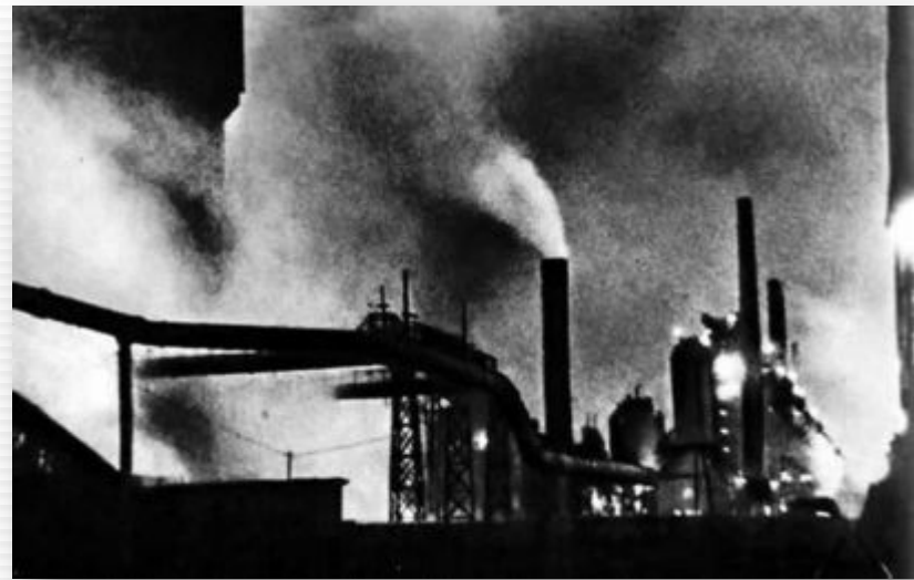
Кузнецкий металлургический комбинат