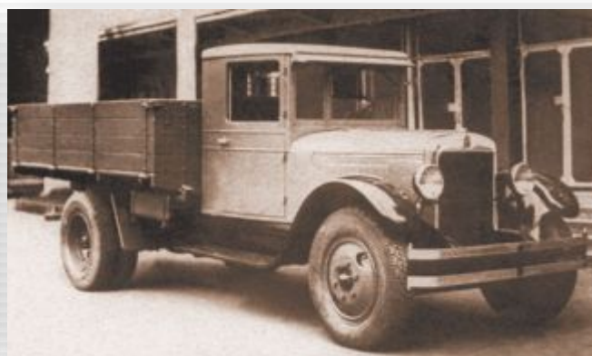
Московский и Горьковский автомобильные заводы