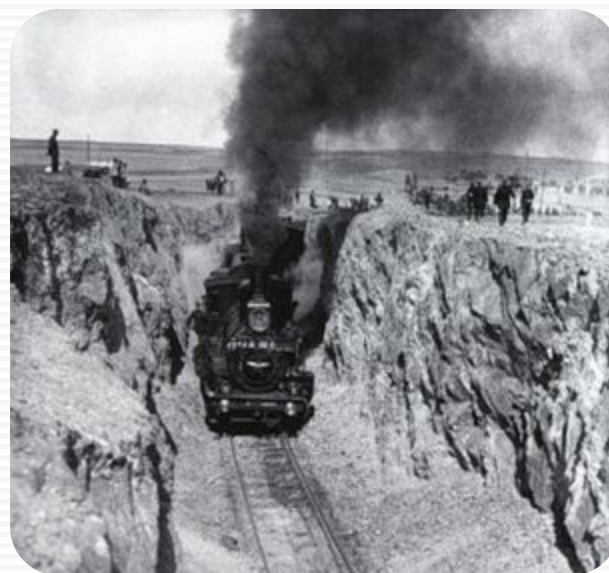
Туркестано-Сибирская железная дорога