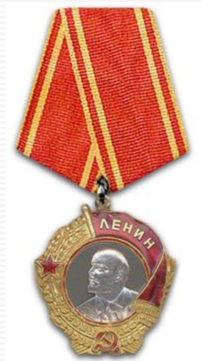
Орден Ленина, 1930 г.