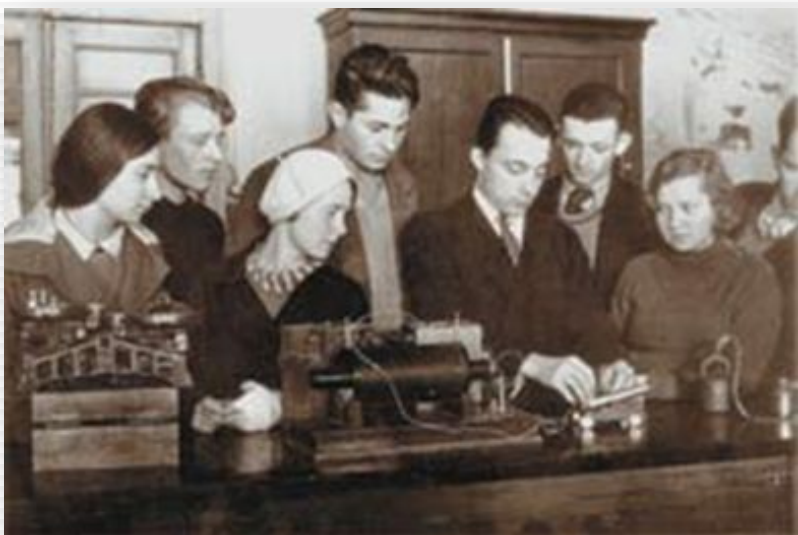
Урок физики на одном из московских рабфаков. Преподаватель объясняет студентам устройство катушки Румкорфа. 1935 год.

В 1934 г. только в тяжелой промышленности различными формами обучения были охвачены 700 тыс. человек, в 1935 г. — 1,5 млн., а в 1936 г. — свыше 2 млн. человек