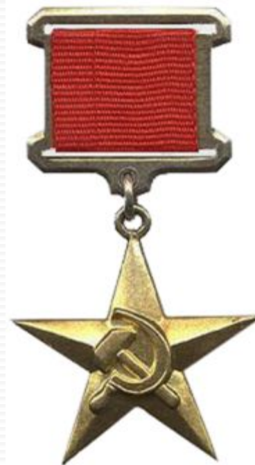
Герой Социалистического Труда, 1938 г.