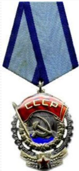
Орден Трудового Красного знамени, 1928 г.