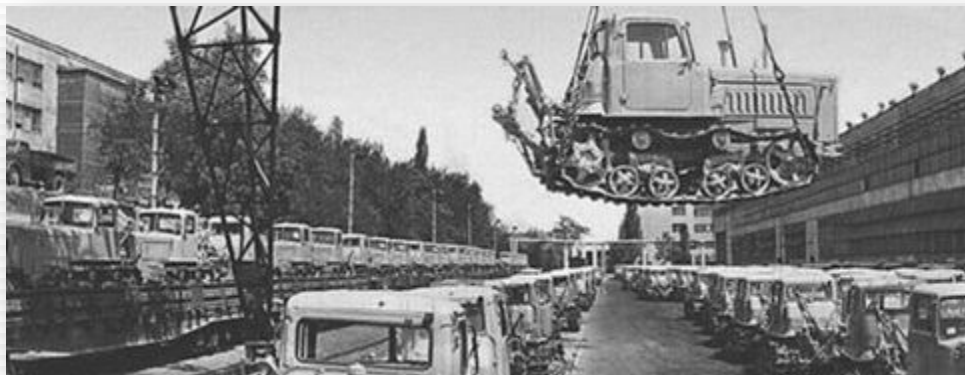
Харьковский и Сталинградский тракторные заводы