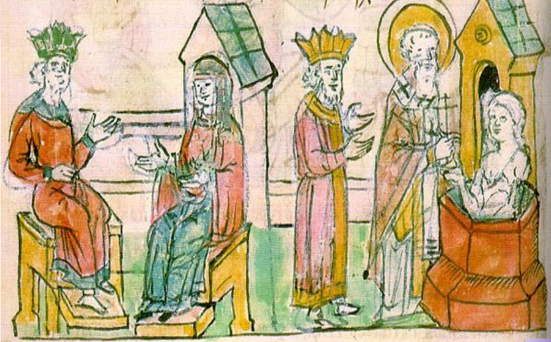
Крещение Ольги в Царьграде