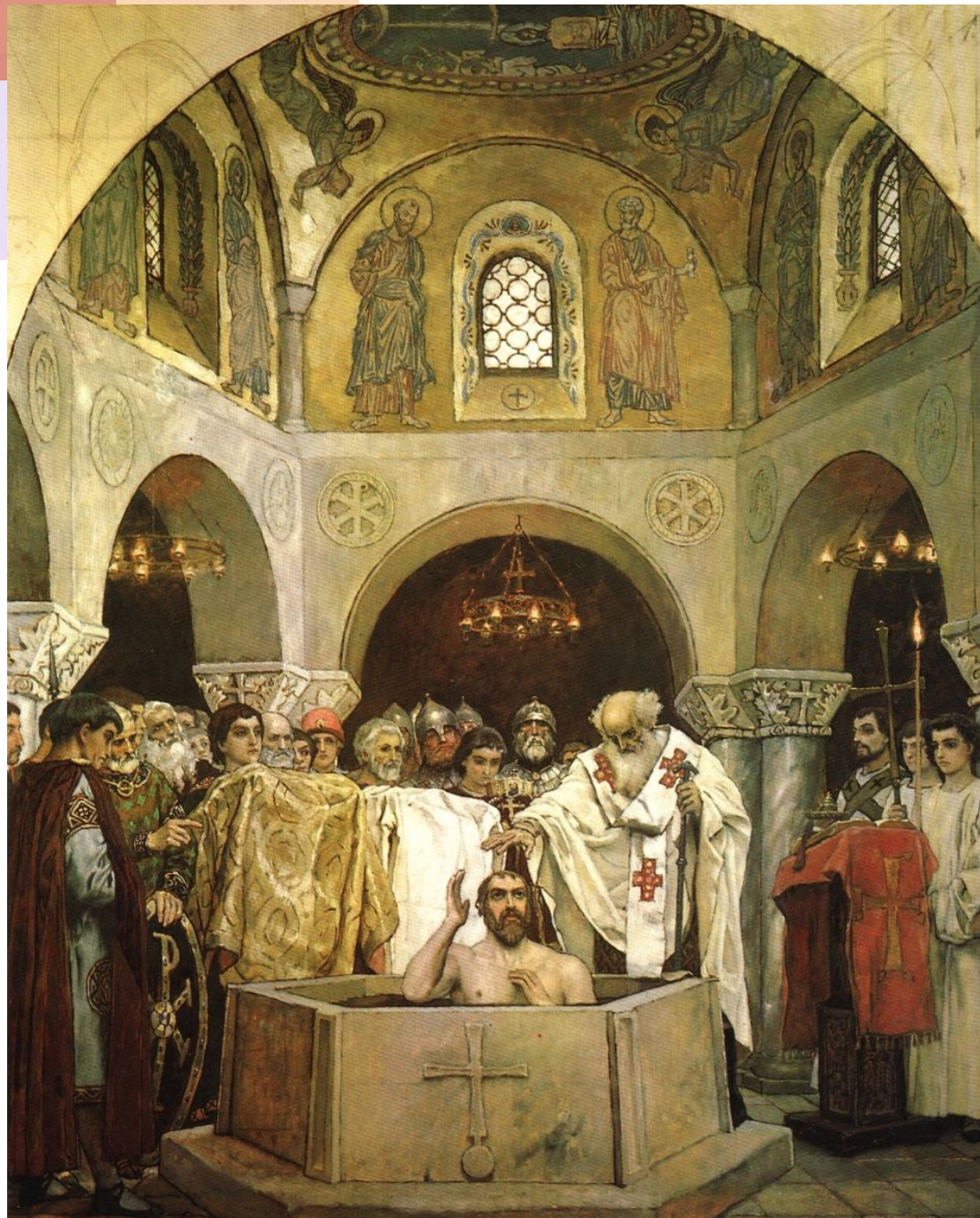
Фреска «Крещение князя Владимира». В. М. Васнецов