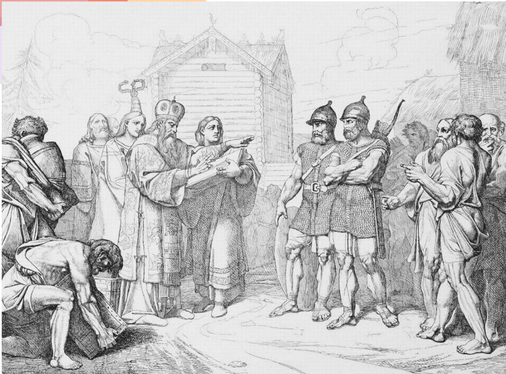
Прибытие в Киев епископа. Гравюра Ф.А. Бруни, 1839