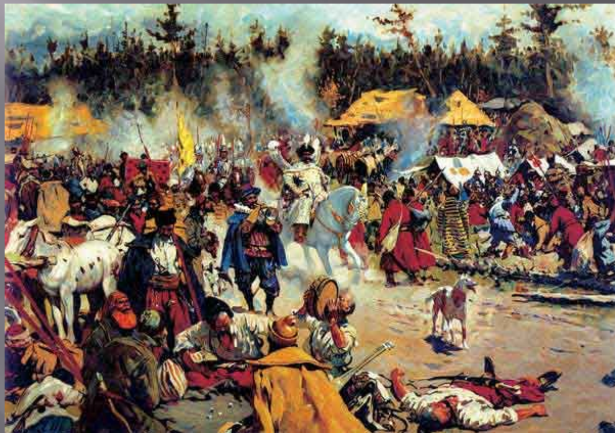
С. Иванов. Лагерь Лжедмитрия II в Тушино.