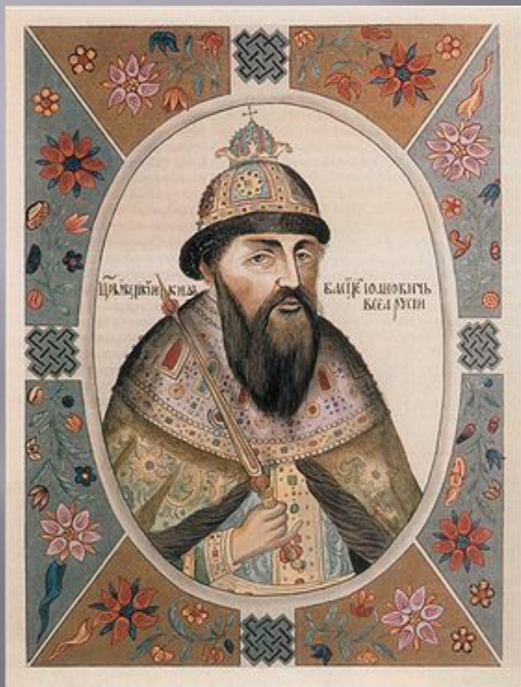
Василий Шуйский 1606-1610 гг.