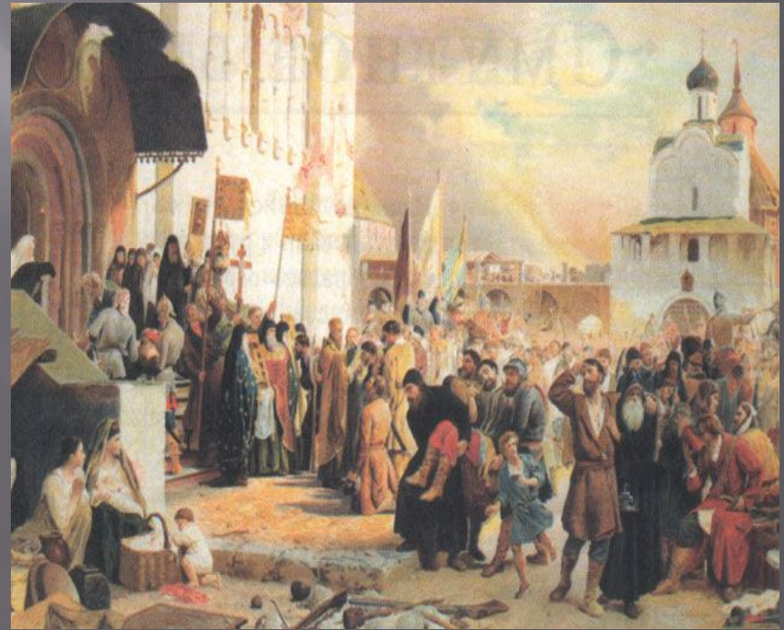
Верещагин В. Польская интервенция