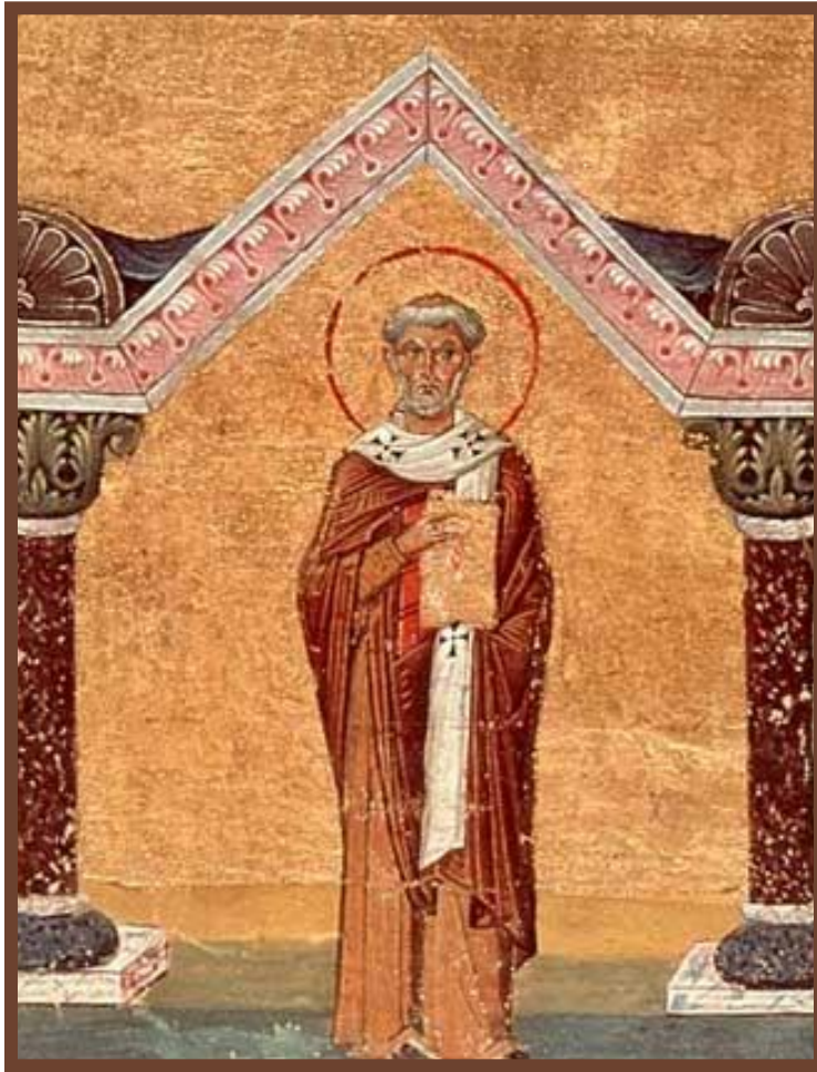
Папа Лев I

«Папы – спасители Рима» 450-е гг. – Лев I – Атилла, Гейзерих (отказ от разорения, смягчение грабежей).