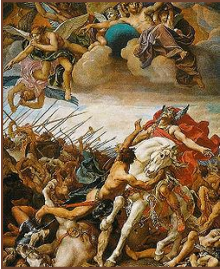
Битва при Толбиаке. Смерть короля вестготов

IV – V вв. – Великое переселение народов