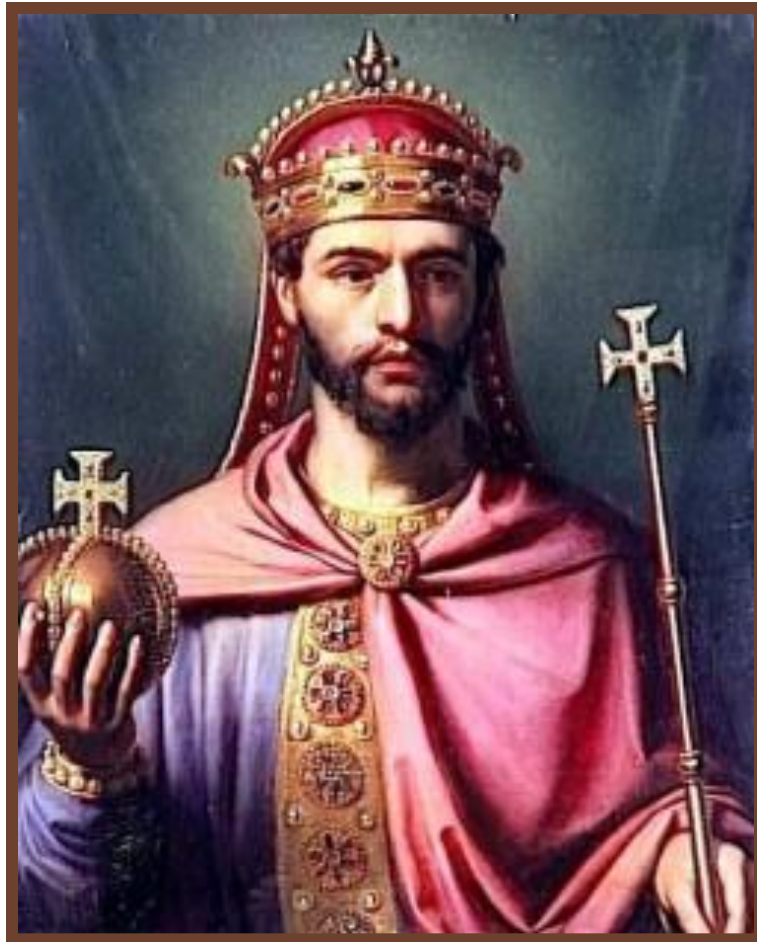
Людовик I Благочестивый

Смерть – развал империи. 814 - 840 г. – Людовик I – выделил земли Лютарю, Людовику и Карлу – усобицы 843 г. – Верденский раздел. Феодальная раздробленность. «Вассал моего вассала - не мой вассал».