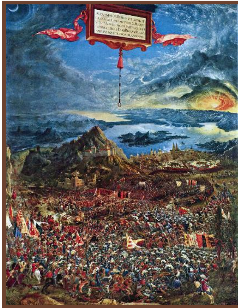
Альбрехт Альтдорфер. Битва Александра Македонского с Дарием

Дарий I – (522 – 486 гг. до н. э.) . 20 округов – Сатрапы (суд, налоги, дороги, каналы и т. д). Армия – военачальник. Единая монета – золотой дарик.