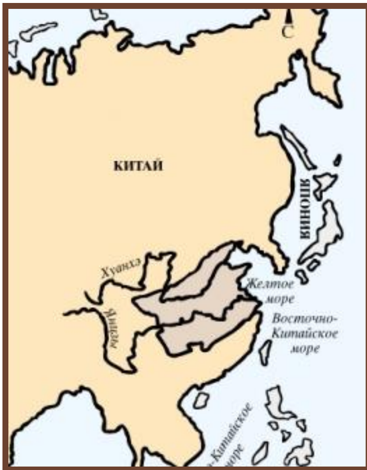
Китай во времена Чжоу

III – II тыс. до н. э. – зарождение государств.