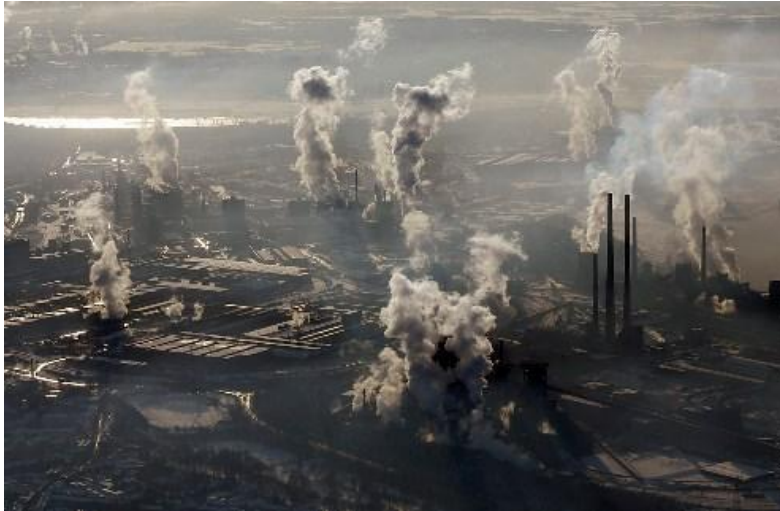
Рурский промышленный район

Версальская система – несправедливость: победители, побежденные.