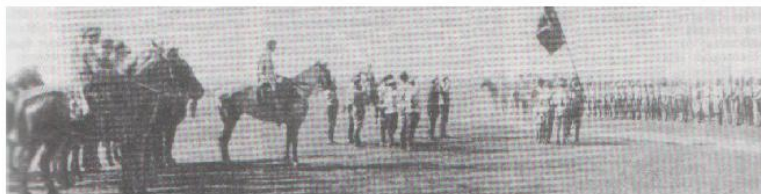
Вручение Красного знамени ВЦИК Латвийской стрелковой дивизии за участие в разгроме армии Деникина. Берислав, 2 августа 1920 года.