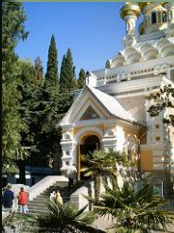
Храм Александра Невского в Ялте