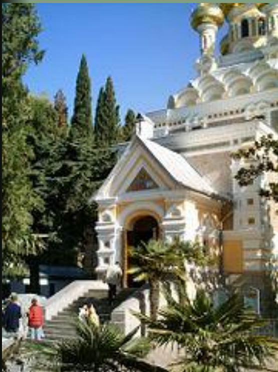
Храм Александра Невского в Ялте