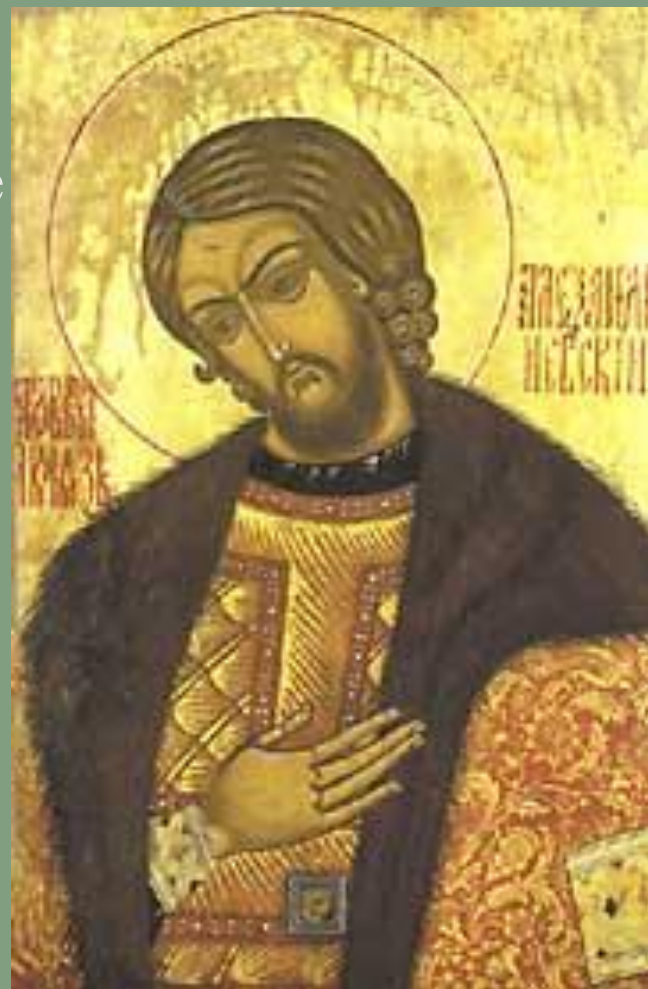
Икона святого благоверного князя Александра Невского