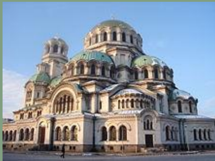
Храм Александра Невского в Софии